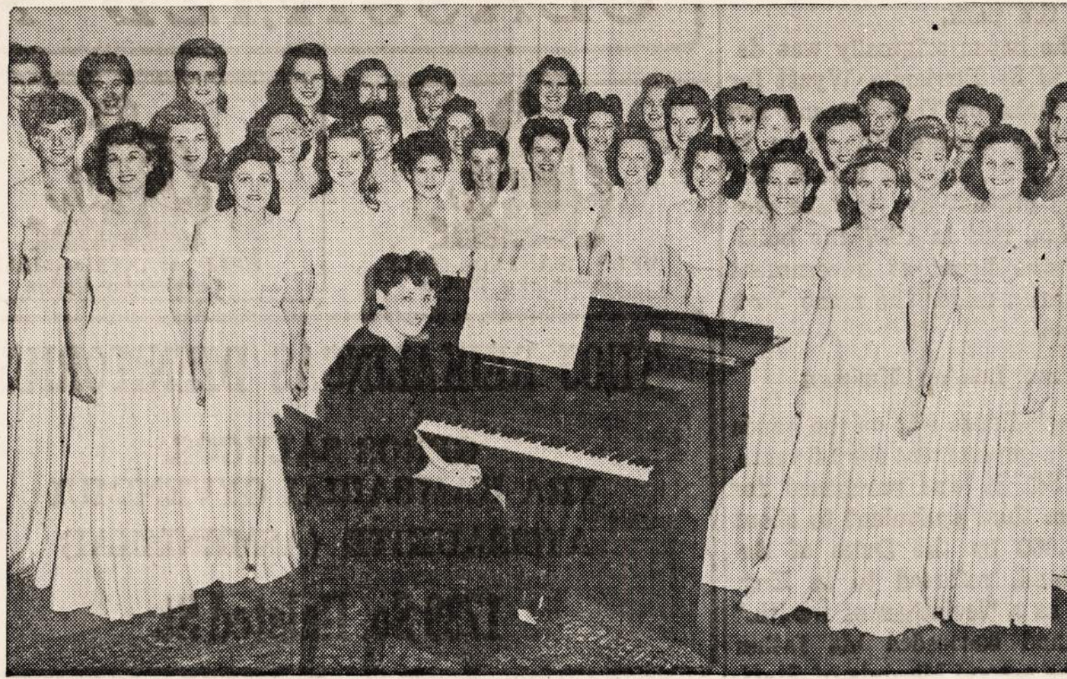
ALICE STEPHENS SINGERS

Garsusis merginų choras, "Alice Stephens Singers", rengia didelį rudeninį koncertą skemadienį, spalio 21 d., Lietuvių Auditorijoje, 3133 So. Halsted St. Koncerto programą susidės daugiausia iš lietuviškų dainų.