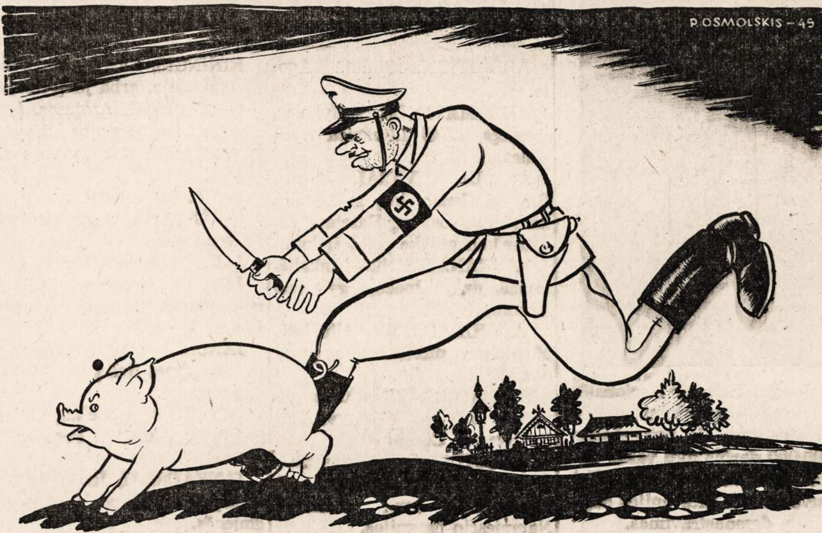
(Šią karikatūrą nupiešė P. Osmolskis, kuris dabar randasi Vokietijoje kaip tremtinys. Ji būdinga yra tuo, kad ryškiai parodo tremtinių nusistatymą nacių atžvilgiu. Satyriškas eilėraštis irgi parašytas lietuviu tremtiniu).

Naciai ūkį Lietuvoje Baisiai reformavo, Gaudė, plėšė, piovė, rijo Ką tiktaai pagavo. Nuo ūkių reformų Verkė mūsų ūkis. Tiktaai naciis tuko, Augo nacio snukis.