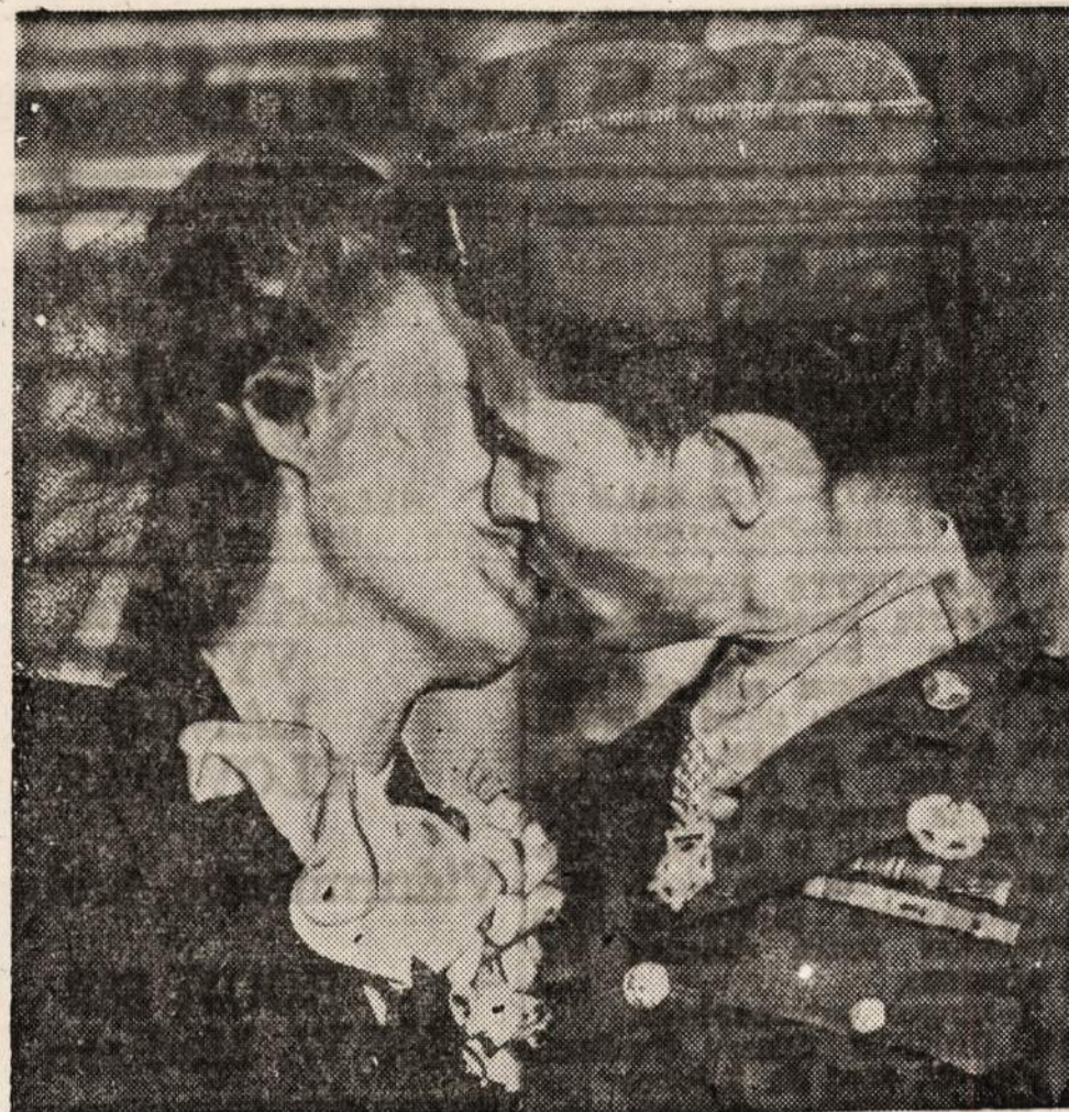
Pfc. Desmond T. Doss iš Lynchburg (Va.), pirmas pacifistas, kuris buvo apdovanotas Kongresiniu medaliu už herojišką žygįs karų fronte. Tą medalį jam įteikė prezidentas Trumanas. Paveiksle vaizduojama, kaip karį Doss pasitiko jo žmona.

Kadangi aš buvau skiriamas karinio policininko pareigoms vėl 11 valandą vakare, tai turėjau sugrįžti į stovyklą anksčiau ir pamiegoti šiek tiek. Vėl ėjau pareigas L.S.T. pakrantėje. Mūsų darbas, penkių vyrų kartu, buvo žiūrėti, kad