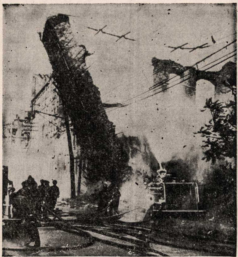
MANAYUNK, Pa. — Gaisras popierio sandėlyje. Kai sukrautas popieris susmuko, tai sužeidė tris gaisrininkus. Gaisro nuostoliai sieks apie $100,000.

REMKITE TUOS, KURIE GARSINASI "NAUJIENOSE"