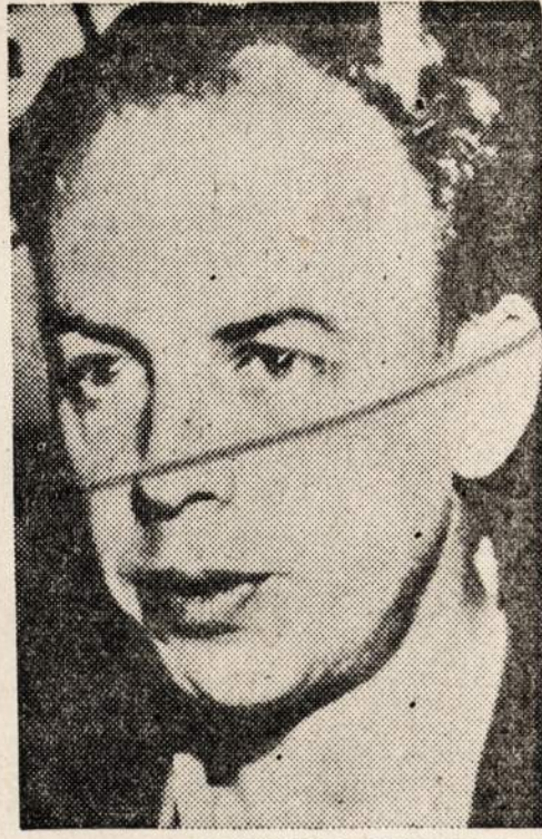
Louis F. Budenz, komunistų "Daily Worker" laikraščio prezidentas ir redaktorius, pasitraukė iš to laikraščio ir Komunistų partijos. Jis grįžo į katalikų tikėjimą ir tapo Notre Dame universiteto pakviestas profesoriaus. Per paskutinius 10 metų jis buvo įžymus Amerikos komunistų vadas.