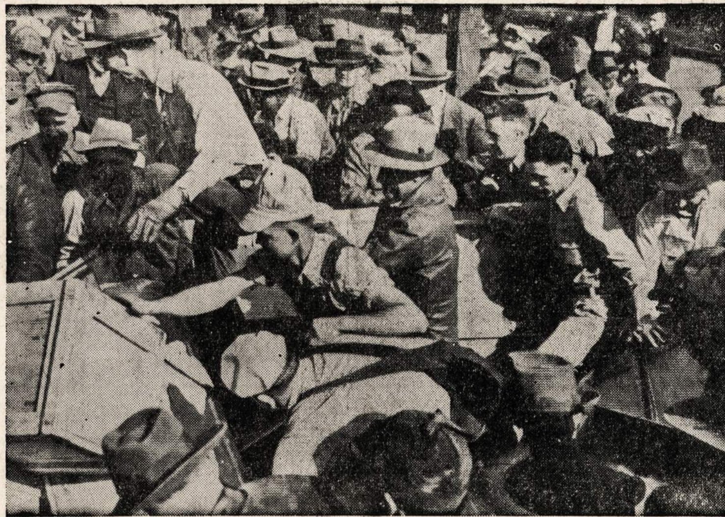
$800,000 vertės guma, gazolinas ir aliejus išmetama kaip atmatos, kurias gali bet kas pasiimti. Visa tai buvo skiriama B-25 bombonešiams.