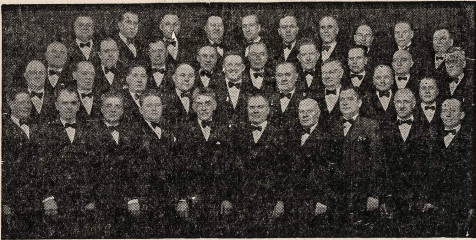
CHICAGOS LIETUVIŲ VYRŲ CHORAS

Šis Chicago Lietuvos vyrų Choras yra veteranų choras. Choro nariai yra geri naujieniečiai. Jie per daugelį metų visuomet dalyvauja "Naujienu" parengimuose. Sekmadienį, lapkričio 4 d., 1945 m., Sokol salėje Chicago Lietuvos vyrų choras dainuos daug naujų dainų. Daugelis dainų bus ištrauktos iš operetės "Grigutis". Šių dainų iki šiol dar niekas nėra girdėjęs. Susirinkę svečiai į "Naujienu" koncertą turės malonumo pasiklausyti pirmą kartą šių dainų.