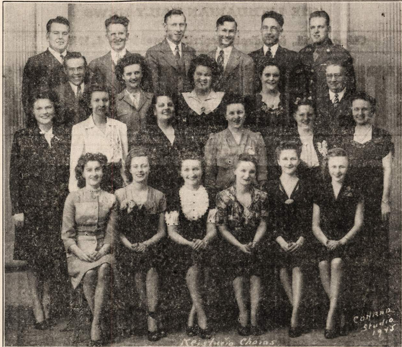
Keistučio Choras; šis šaunus choras dainuos Keistučio Klūbo koncerte rytoj, sekmadienį, lapkričio 18, Chicagos Lietuvių Auditorijoje, 3133 So. Halsted street. Dainuos taipgi kiti du chorai, būtent Vyrų ir Alice Stephens Singers. Pradžia 5 val. vakaro.