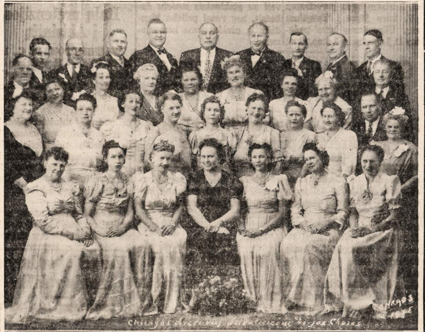
Programą pildys Chicagos Lietuvių Suvalkiečių Draugijos Choras PO PROGRAMO ŠOKIAI