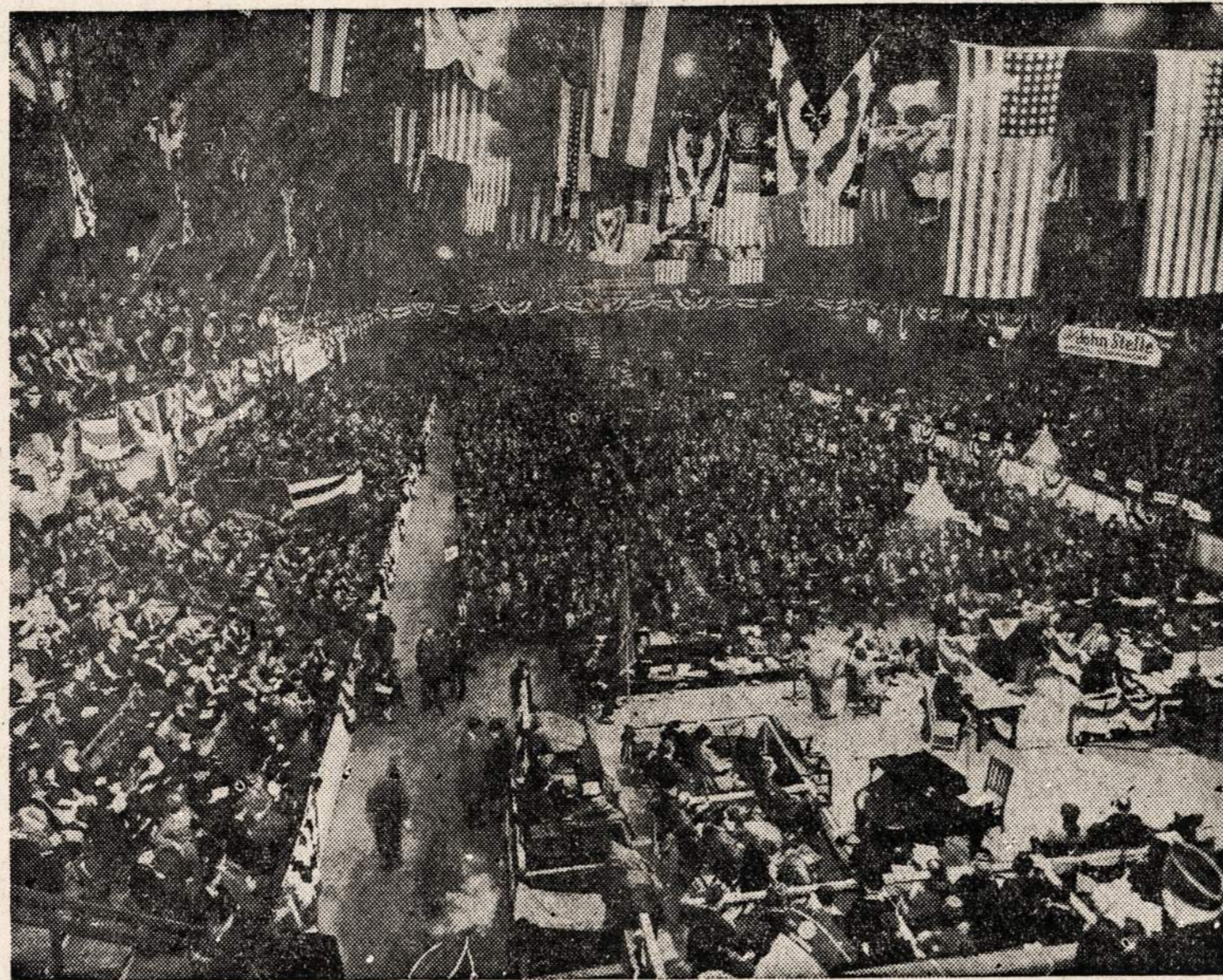
Legionieriai renkasi į Chicago koleseumą, kur prasidėjo jų konvencija. Delegatų dalyvauja 12,000 su viršum.