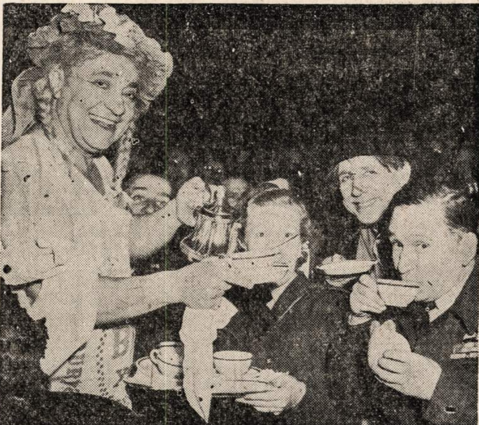
Chick Johnson (po kairei) ir Ole Olsen vaišina arbata Sir Arthur Tedder ir jo žmoną "Laffing Room Only" vaidinimo metu Chicagoje.