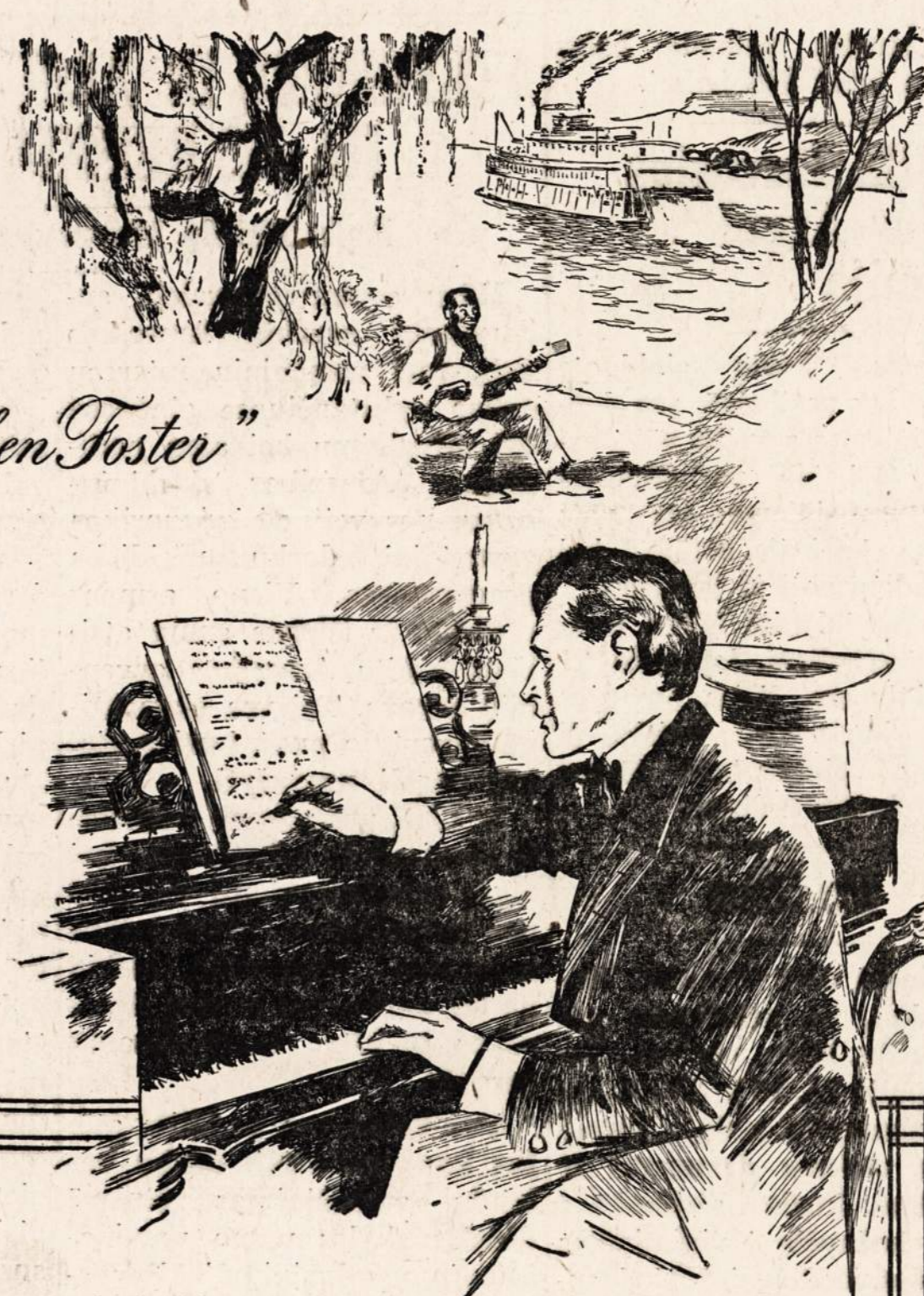
STEPHEN FOSTER (1826-1864) parašė "Old Folks at Home", "My Old Kentucky Home", "Old Black Joe", "Massa's In the Cold, Cold Ground", ir daug kitų Amerikos mėgiamų dainų.