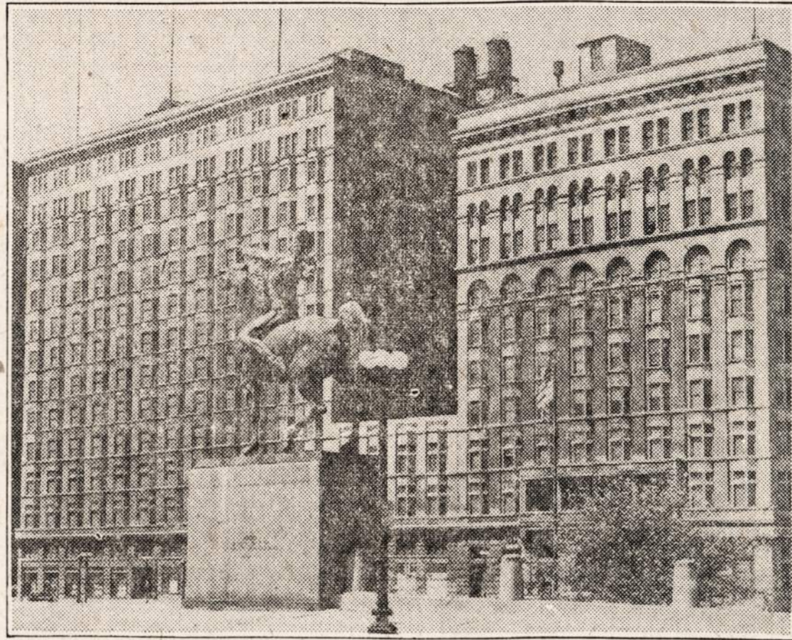
CONGRESS HOTEL, 520 So. Michigan Ave., Chicago, Illinois.