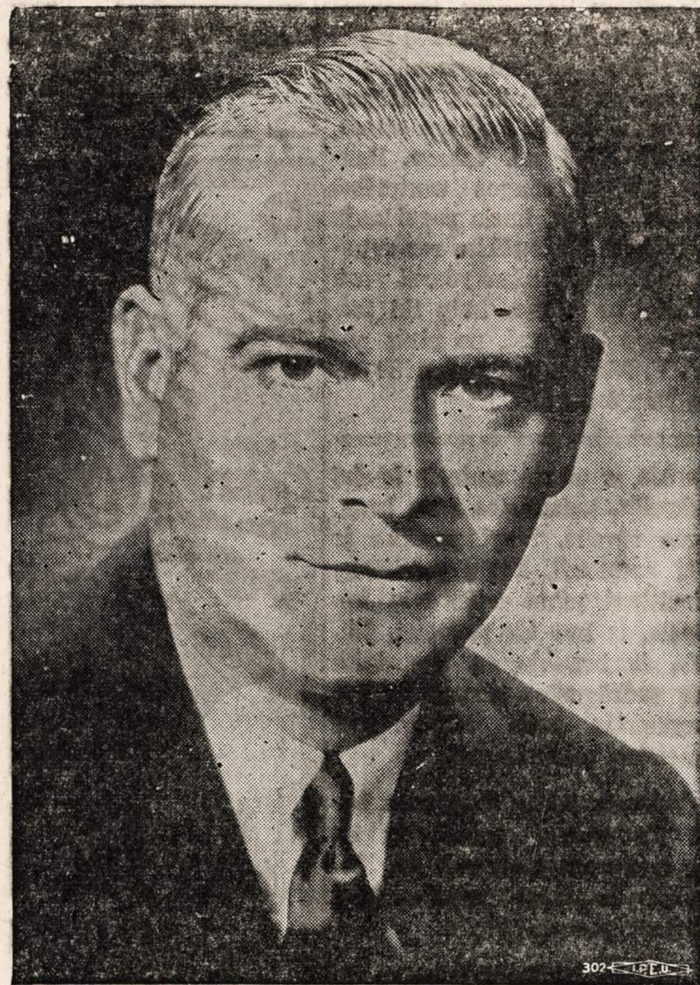
DWIGHT H. GREEN Illinois valstijos gubernatorius.

Šiandien, penktadienį, Amerikos Lietuvių Kongrese, Congress viešbuty, yra svarbių kalbų diena. Popietiniai posėdyje pasakys kalbą Chicagos katalikų vyskupijos galva, J. E. arkivyskupas Samuel A. Stritch, o vakare, Kongreso bankiete, laukiama Illinois valstijos gubernatoriaus Dwight H. Green kalbos.