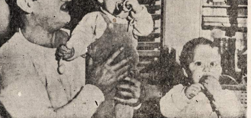
Dvi poros dvynukų, kurie gimė p-iai Gabel (viršuje, po dešine) ir jos vyrui (žemai), kuris yra radio rašytojas.

aš buvau darbe. Ir kiek to darbo buvo! Mano bosas" mangs laukė pasitenkinęs, nes tiek daug darbo jįsai man buvo parūpinęs, kad tik dabar, galio sakyti, sutvarkiau viską. Bet viskas buvo verta tos savaitės atostogų, kurias praleidau šalies sostinėje, Washington, D. C. —Juzytė