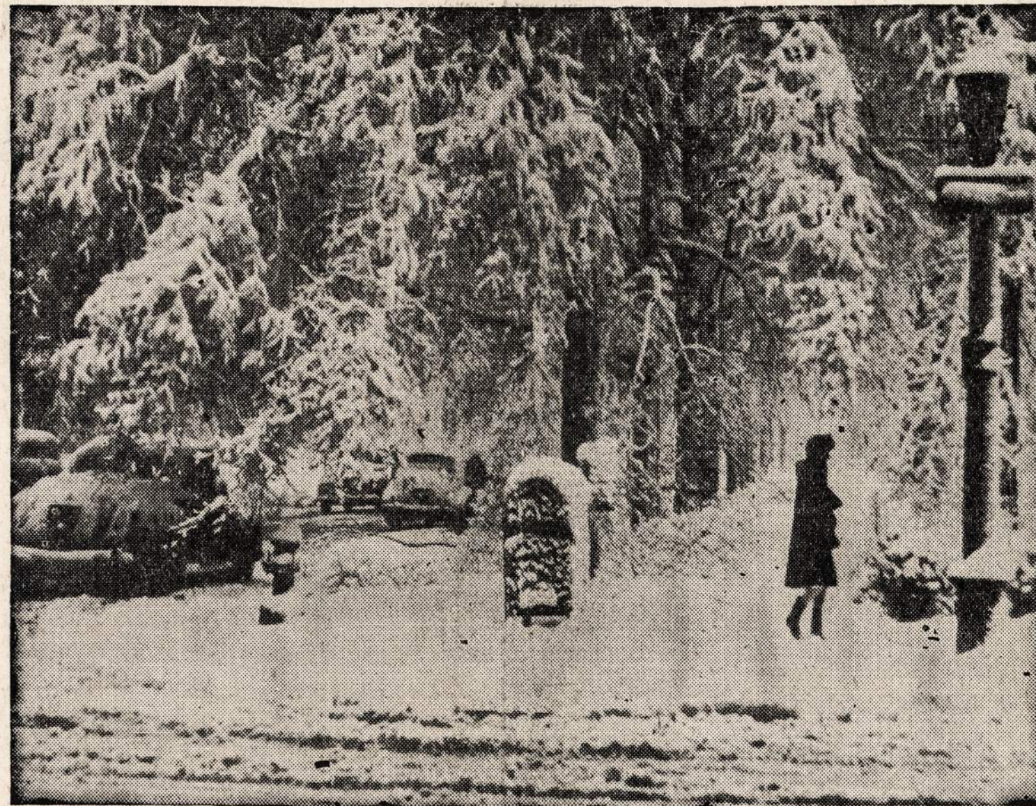
Pirmas šios žiemos sniegas jau apklojo žemę. Vietomis jo iškrito dešimties inčių sluoksnis. Šiaurės valstijose laikinai nutrauktas automobilių susisiekimas, nes keliai užpustyti.