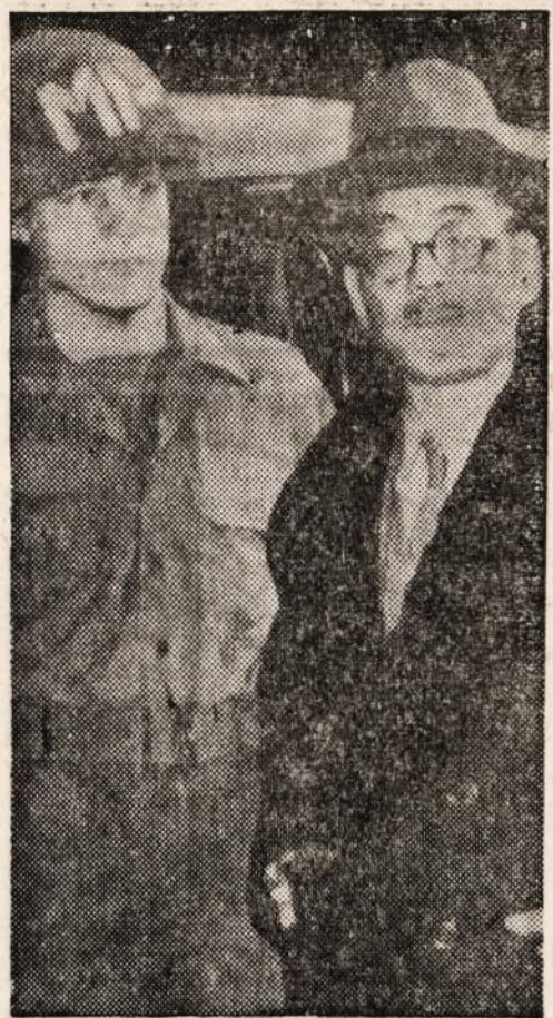
Toshid Shiratori, Japonijos užsienių reikalų ministras, pasitarėjas nuo 1940 iki 1944 m. Jis yra laikomas pikčiausiu militaristu. Dabar jis patuptytas kalėjime su kitais karo kriminalistais.

„Pasta“ gali būti padaryta iš rupių miltų, bet „pasteta“ jau turi būti iš smulkių, gerai sijotų.