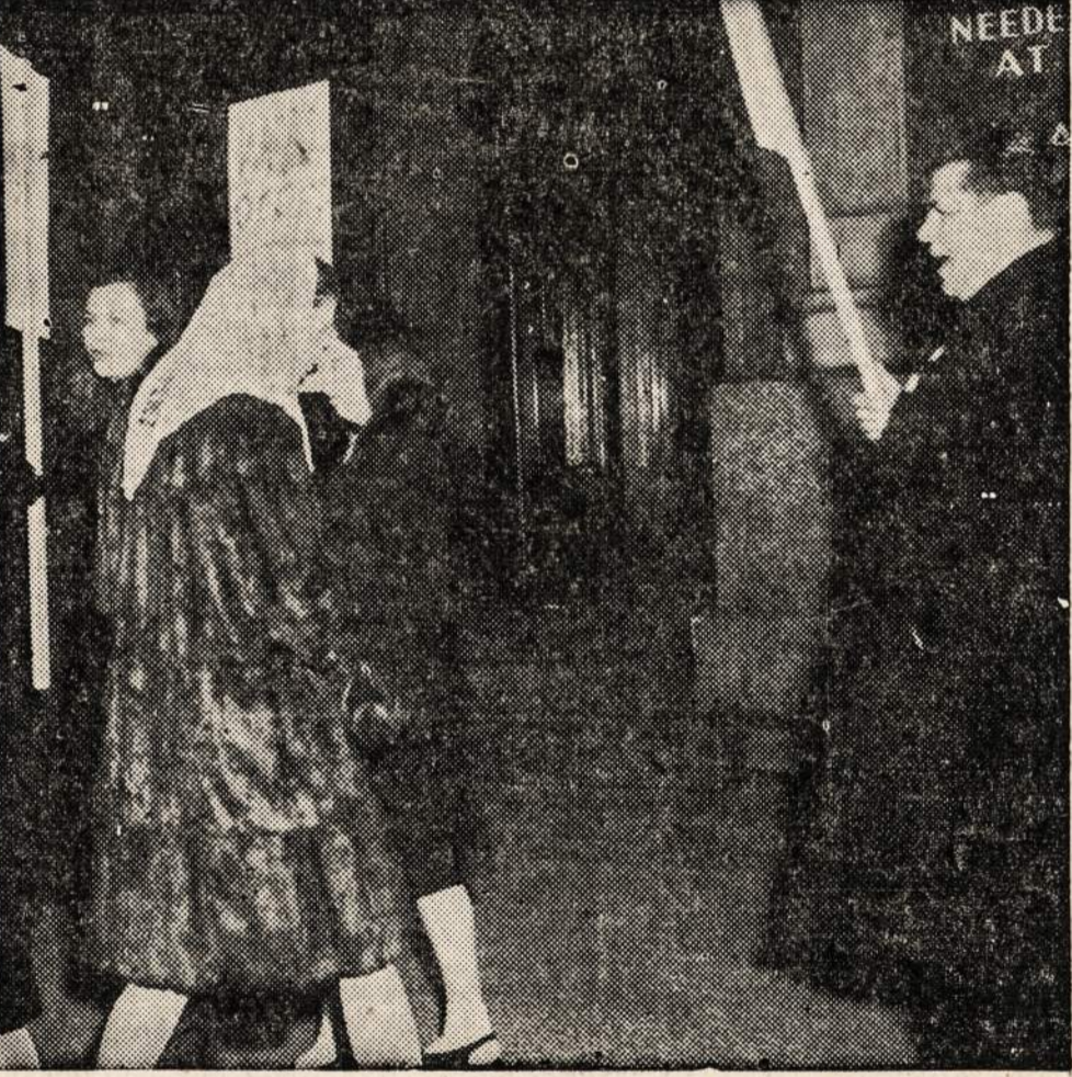
Montgomery Ward and Co. Chicagoje, kur vėl kilo streikas ir prasidėjo pikietavimas.