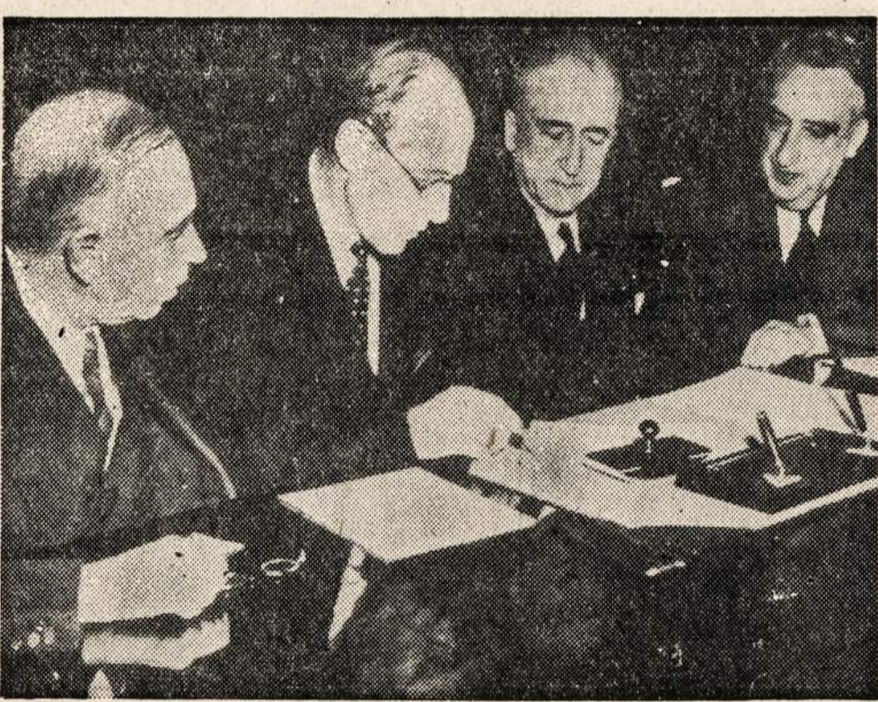
Britų ambasadorius lordas Halifax pasirašo paskolos sutartį su Amerika. Anglija iš Amerikos gaus $4,000,000,000 paskolą. Iš kairės į dešinę: lordas John Maynard Keynes, lordas Halifax, valstybės sekretorius James Byrnes ir izdo sekretorius Fred Vinson.

BUSINESS CHANCES Biznio Progros KAMPINIS LUNCH ROOM 99 ir Western. Pilnai irengtas. $1,450. STEWART 1185 FURNITURE-FIXTURE FOR-SALE Rakandai ir Įtaisai Pardavimui MODERNIZUOKIT Sayo Virtuve arba Bathroom su Steel Wall Tile kambarys 5x7, 5 pėdų aukščio $84.00. Sudėsimė—Kreditas HEMLOCK 3200 Pasirinkimas gražiausių spalvų. GERAME STOVYJE anglinis pečius. Mažai vardotas. Prieinama kaina. 4337 So. Spaulding Ave., 3 aukštas.