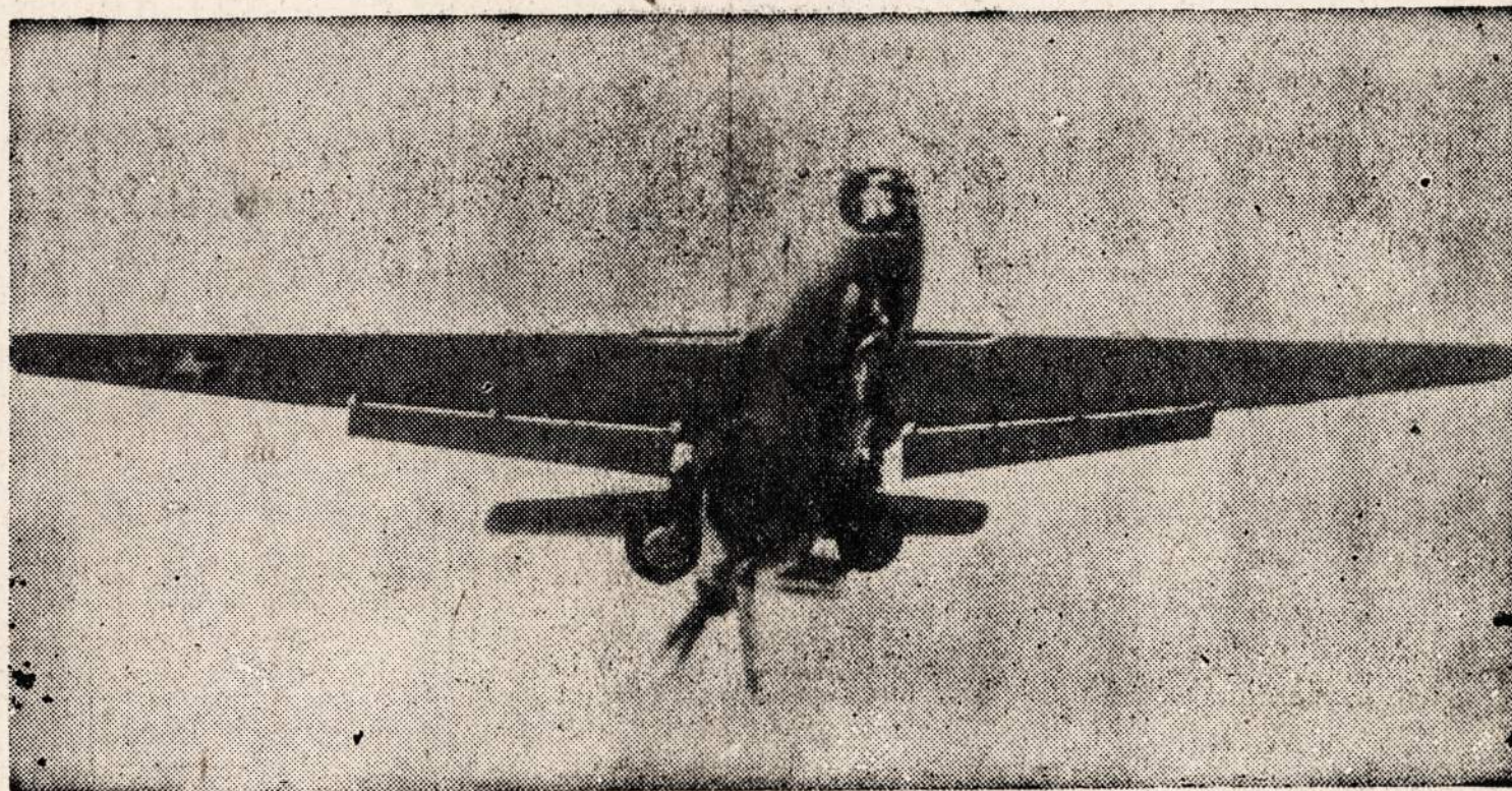
Bandomasis armijos bombanešis Douglas XB-42, kuris yra žinomas kaip "Mixmaster". Per 5 val. 17 minučių jis nuskrido 2,295 mylias. Per valandą skrido 432 mylias. Šis paveikslas buvo nutrauktas Long Beach, Calif.