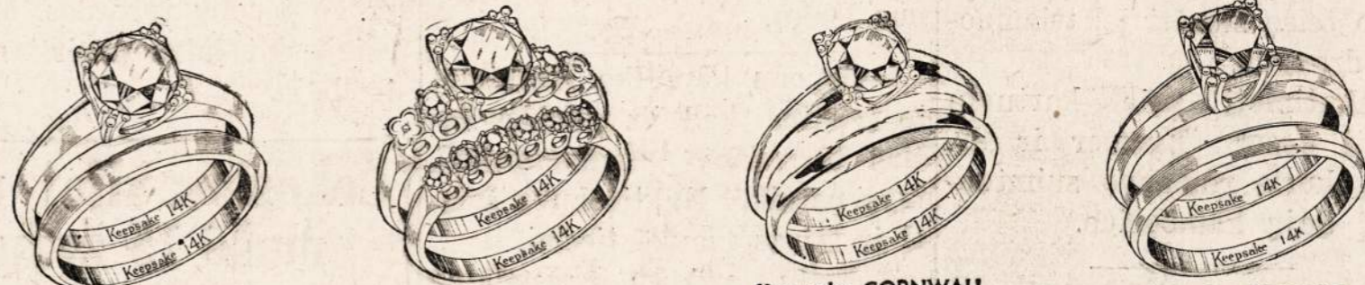
Keepsake AMES Engagement Ring 250.00 Wedding Ring 10.00