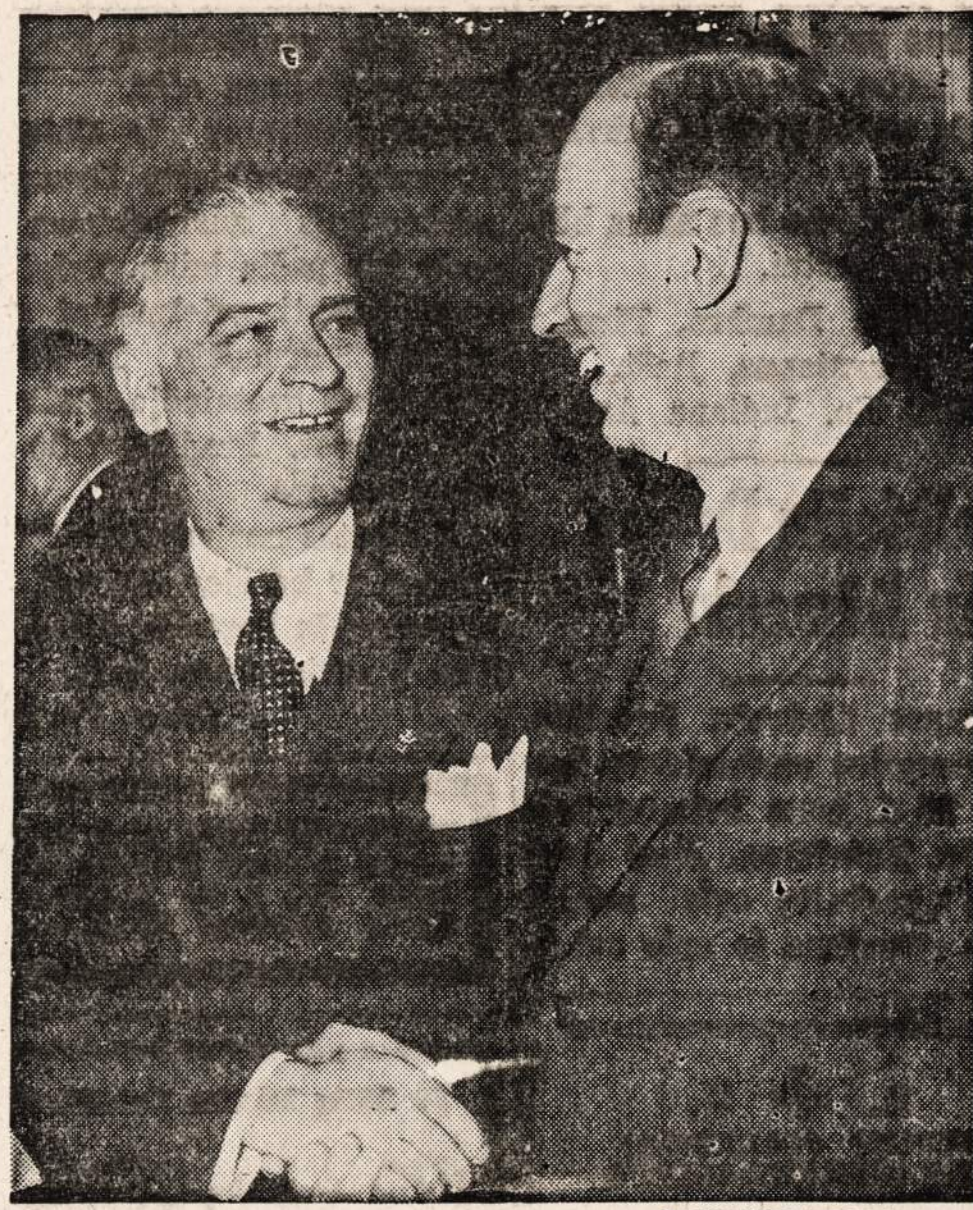
Gubernatorius Dwight H. Green pareiškė, jog respublikonų partija turi nacionalius rinkimus laimėti...