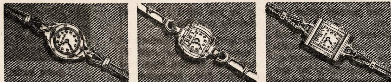
GODDESS of TIME 17 Jewels ... $37.50