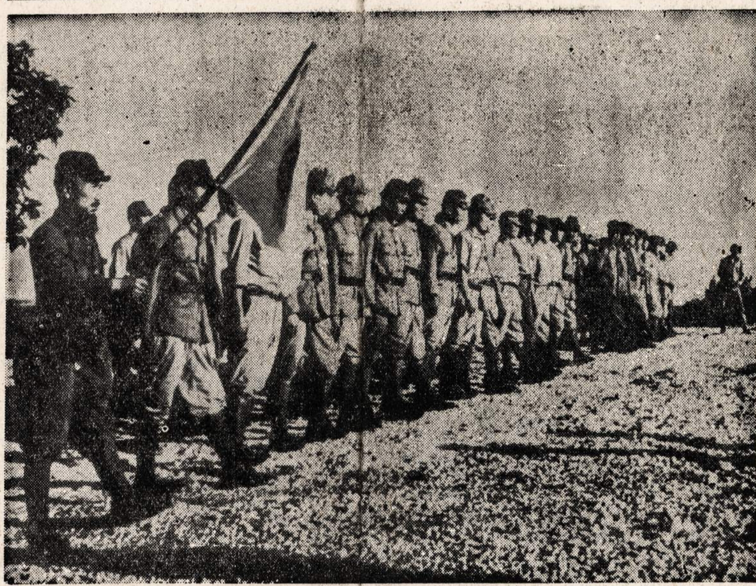
Japonų kariai ir jūrininkai pagaliau pasidavė amerikiečiams Saipan saloje. Jie slapstėsi džunglėse ir urvuose 17 mėnesių.