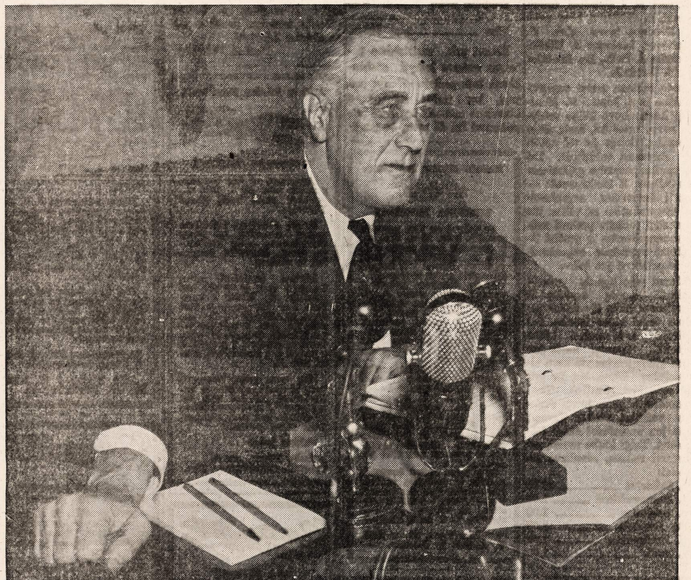
A FITTING TRIBUTE TO THE MEMORY OF OUR GREAT WARTIME LEADER...THE PURCHASE OF THE

Honor the Man Who Brought Us to the Threshold of . . . Victory!