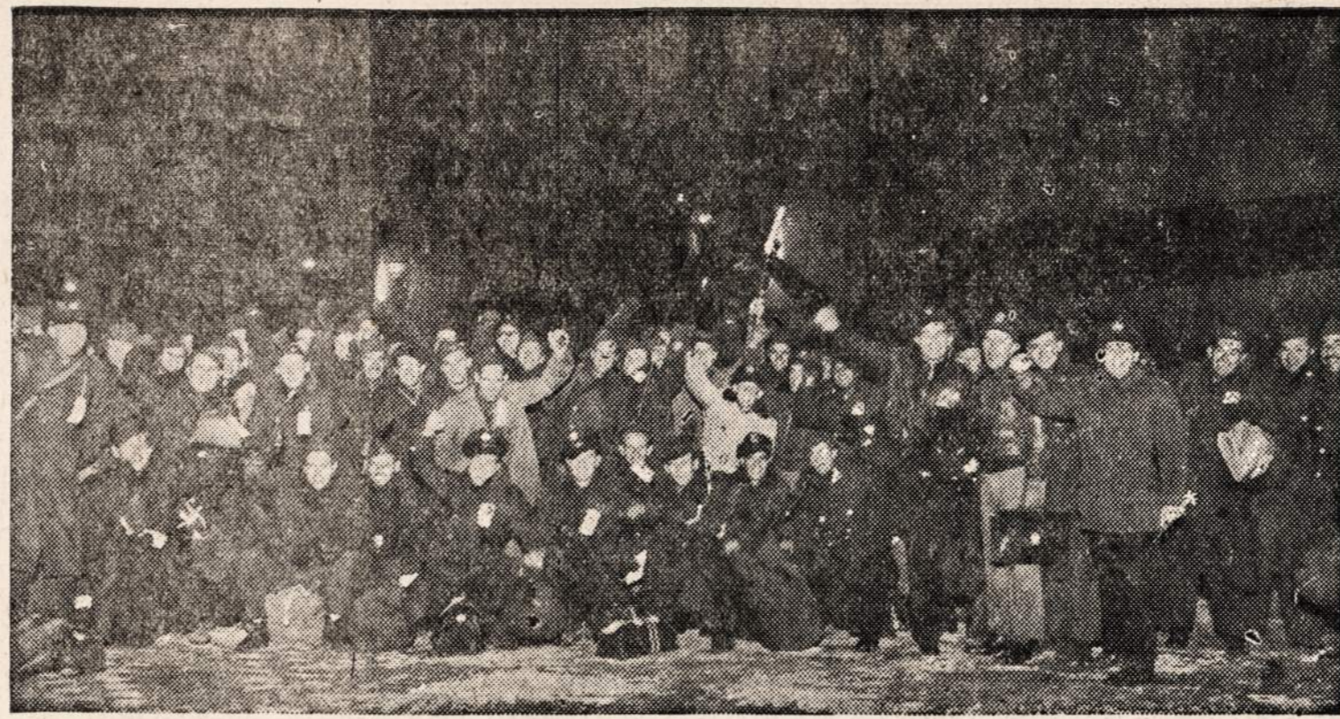
Municipalis aerodromas Chicagoje, kur atskrido lėktuvai iš Seattle (Wash.) su kareiviais ir negalėjo toliau keliauti.

Kai ji šį eilėrašį rašė, tai ir patys fanatiškiausiasieji Lietuvos komunistai Stalino dar ne-lygino su saule, todėl ji čia tu-rėjo galvoje tikrąją saulę, o ne žmogų, kuris milijonams sau-lės šviesą atėmė.