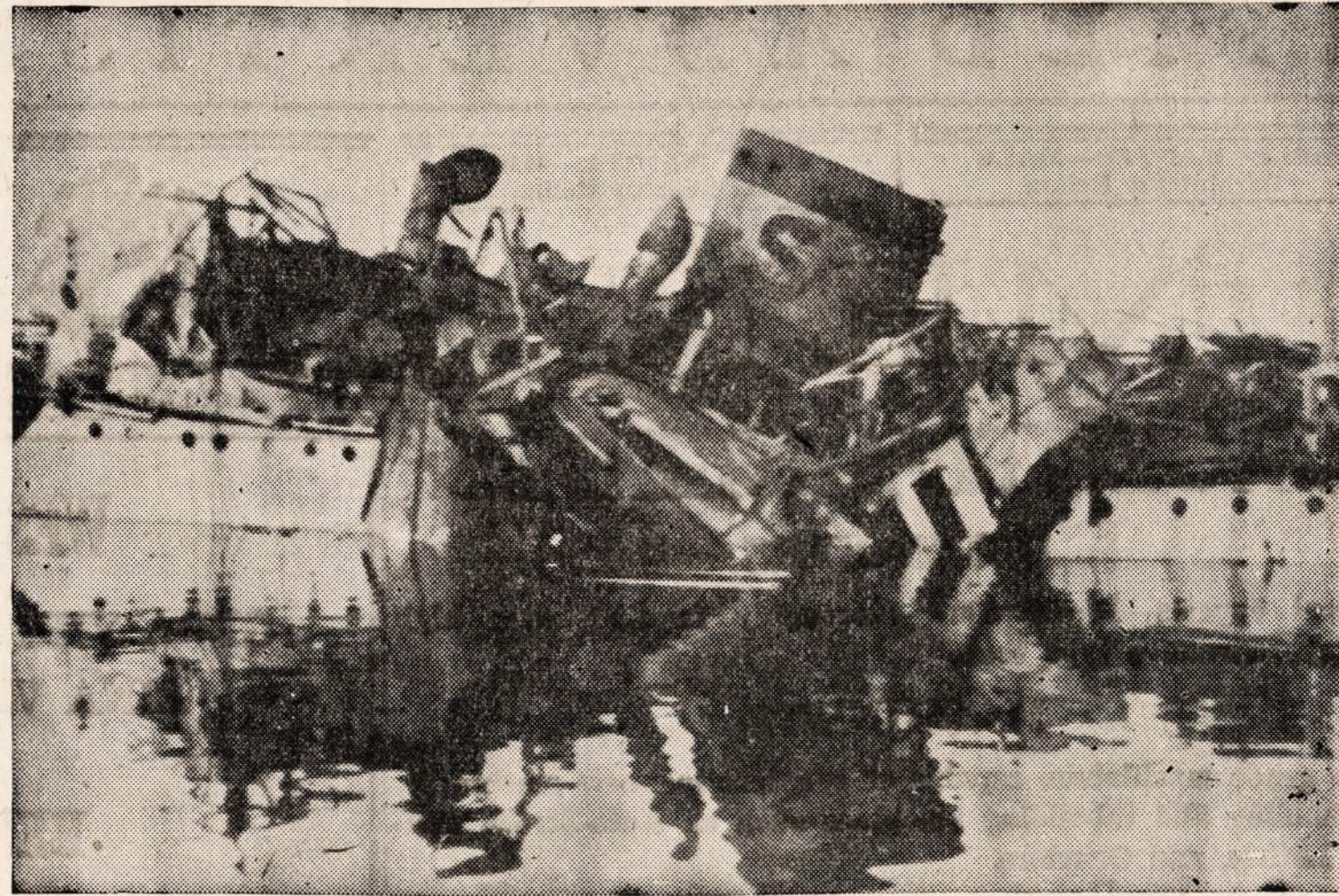
Texas pakraščiuose sprogo švedų laivo "Sveaborg" pečius, nelaimės metu gyvybės neteko aštuoni jūrininkai, o 12 buvo sunkiai sužeistų. Vėliau ir pats laivas nuskendo.

į USA emigravo 1924 m., spėjama gyvena Brooklyn, N. Y.