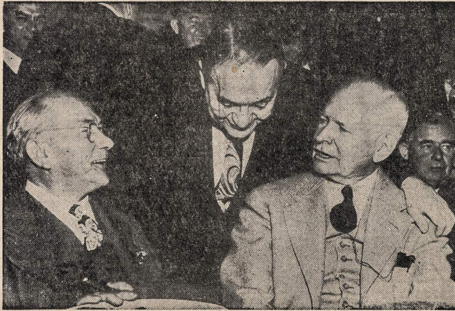
Senatorius Theodore Bilbo (po kairei) juokauja su kitiems senatoriais. Daromos yra pastangos iš republikonų pusės neišleisti jo į Senatą.