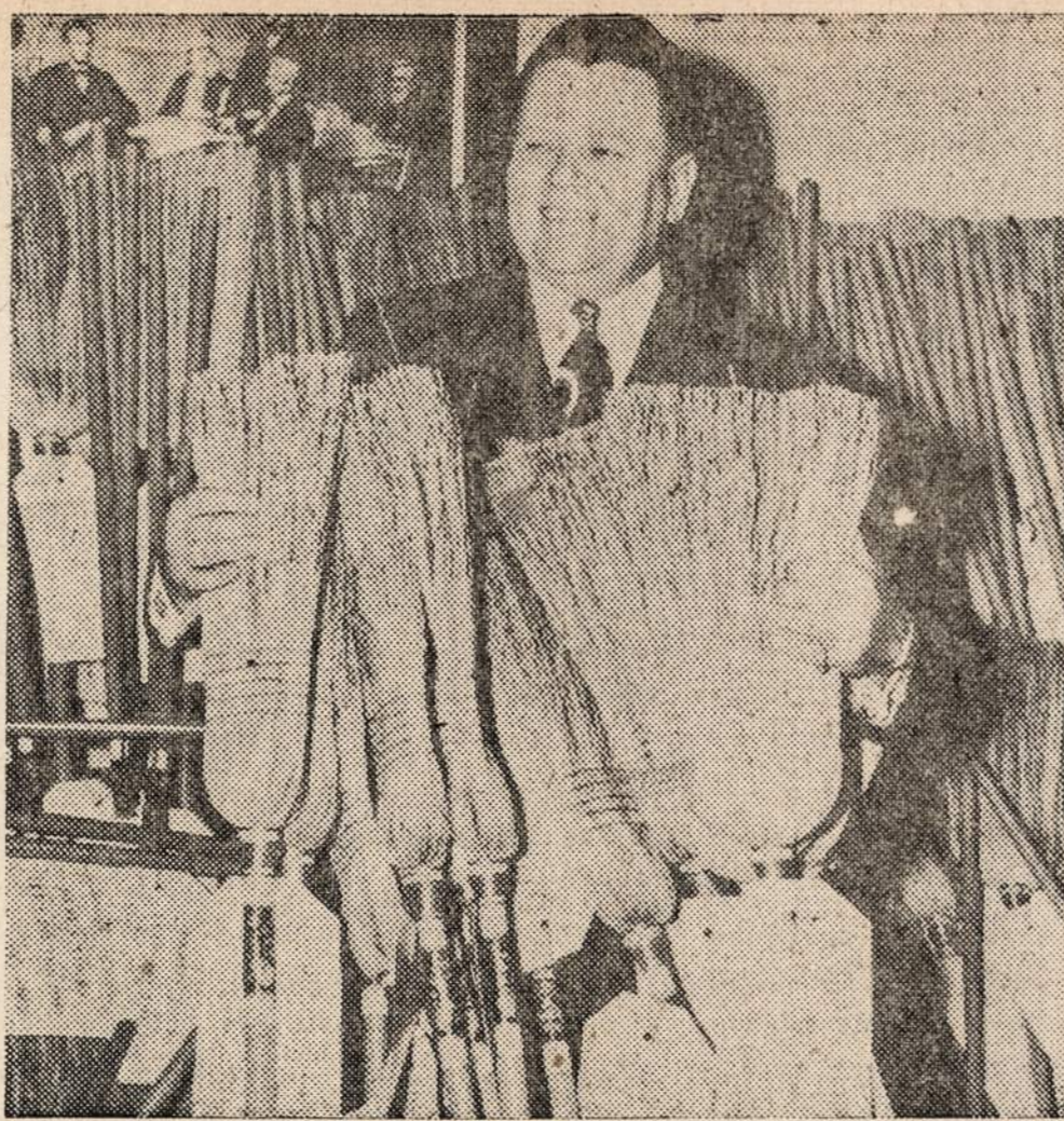
Kongresmanas George H. Bender (iš Ohio) padalino naujai išrinktiems republikonams kongresmanams naujas šluotas, kad tie "išsluotų" per paskutinius kelis metus susidariusias šiukšles.

REMKITE TUOS, KURIE GARSINASI "NAUJIENOSE"