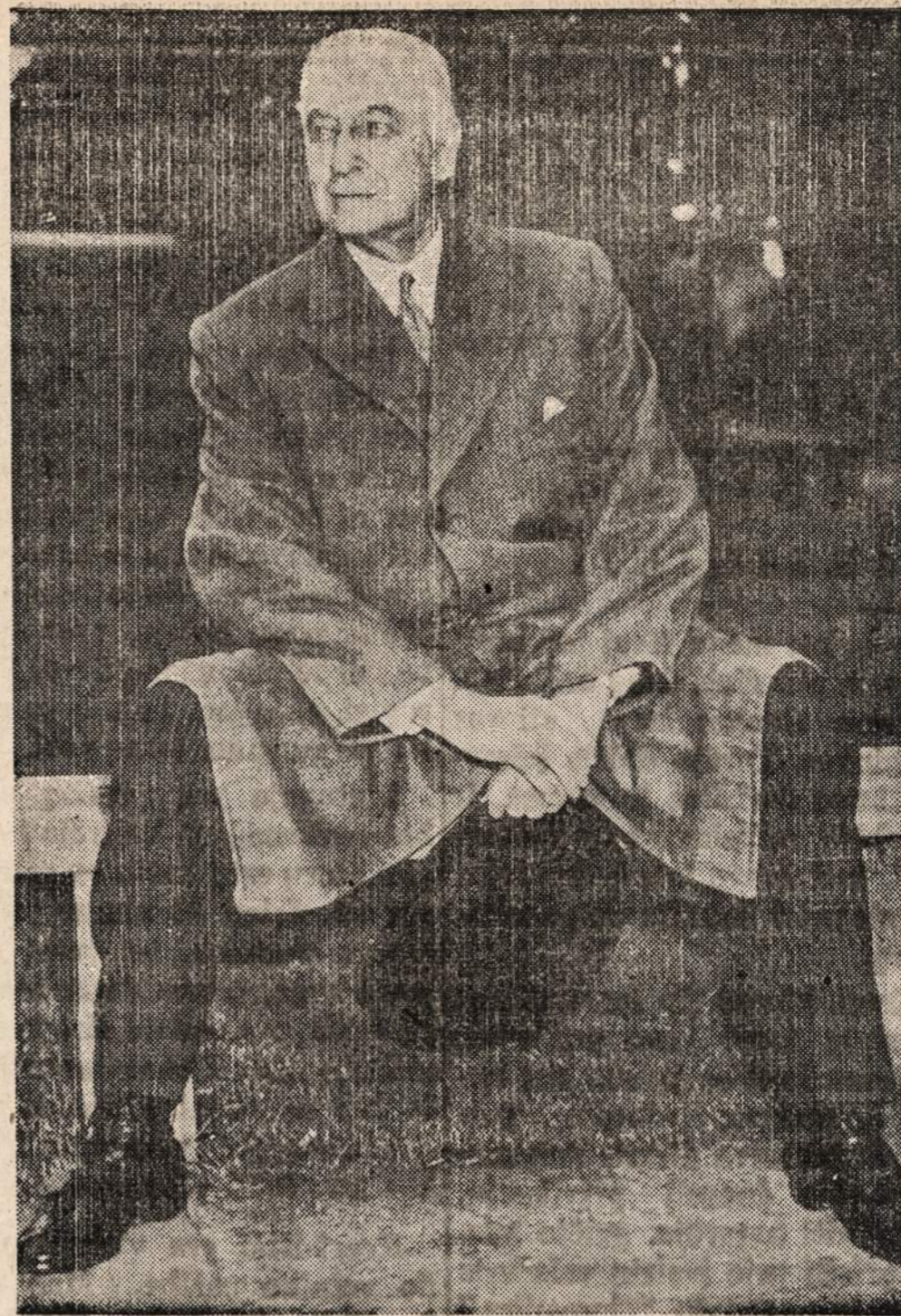
Bernard Baruch rezignavo iš Jungtinių Tautų Atominės Energijos Komisijos. Pasitraukdamas iš komisijos, jis patarė Amerikai ir toliau gaminti atomines bombas, kol nebus įsteigta tikra pasaulinė taka.