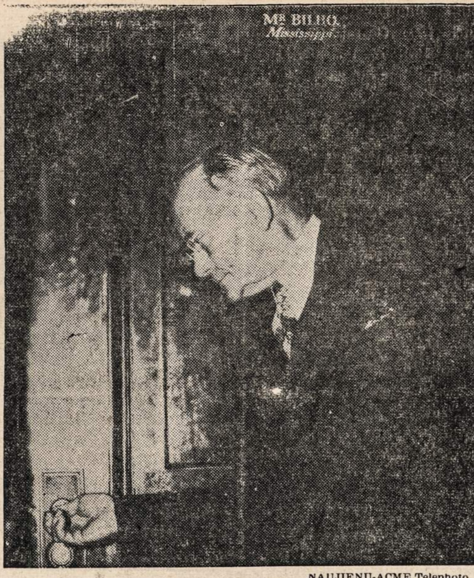
Senatorius Theodore G. Bilbo užrakina savo ofisą Senato trobesyje. Jis išvyk į New Orleans, kur jam bus padaryta operacija.