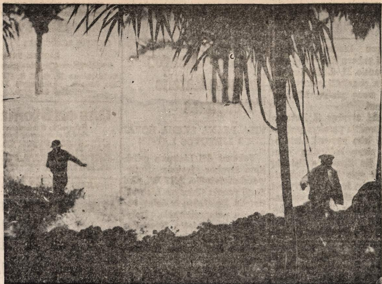
Hilo, Havajų salys.—Siaučia nepaprastai audra. Milžiniškos bangos ritasi per vadinamąją jūros sieną.