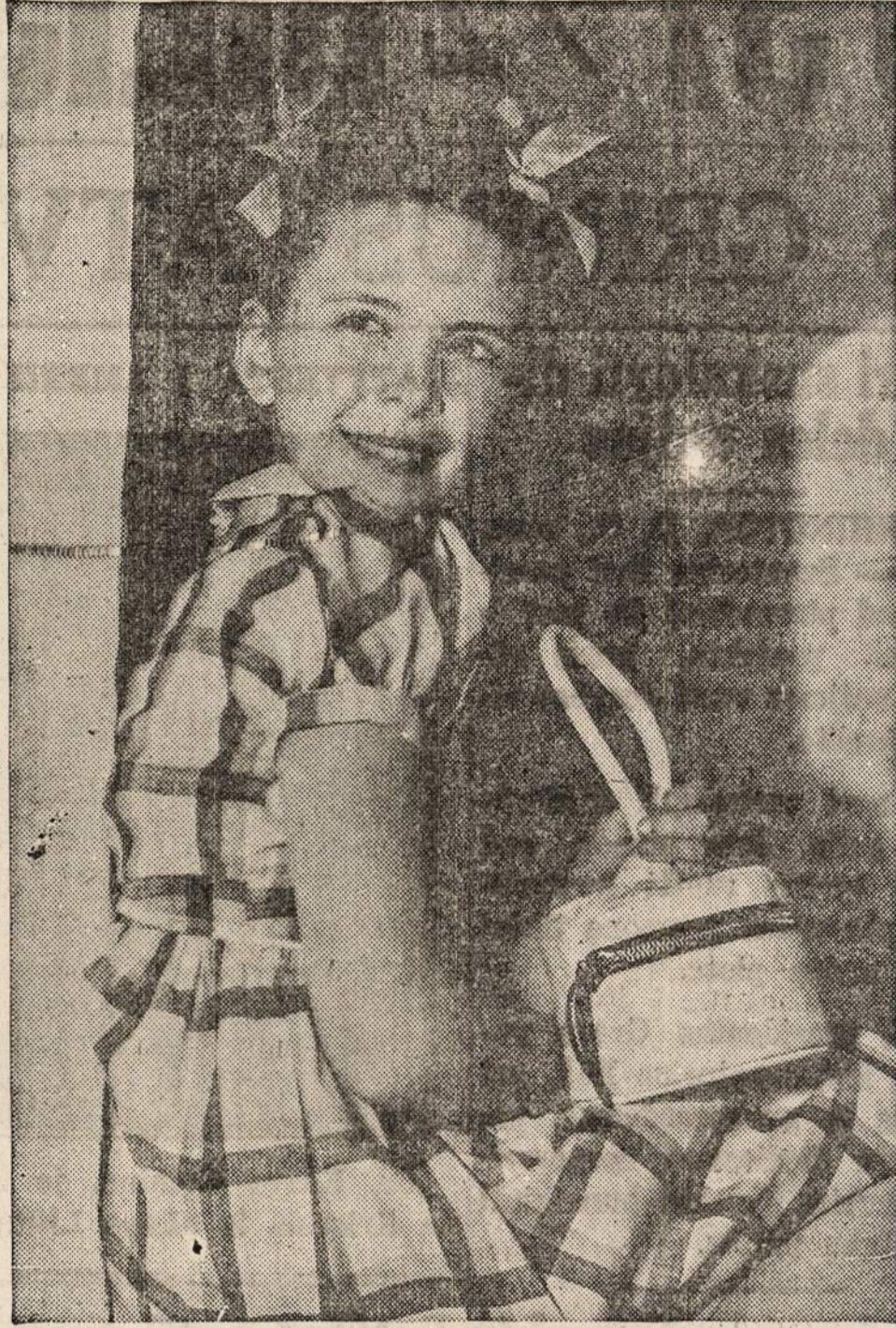
MARGARET O'BRIEN has two good reasons for that happy smile. Santa Claus will soon be around to pay her a visit, and M-G-M has given her a colorful new role in a drama of New York streets called "Tenth Avenue Angel."

vardus. Už tai, tikėtasi, man tos gerosios lietuviškos atleis.