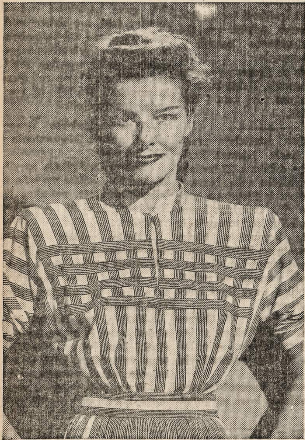
KATHARINE HEPBURN registers satisfaction over her new blue and white striped jersey dress for morning wear, designed by Irene for the star's wardrobe in her latest M-G-M film "Undercurrent." Diagonal stripes over the upper part of the bodice and on the skirt furnish an interesting detail. High neckline and matching belt add the finishing touches.