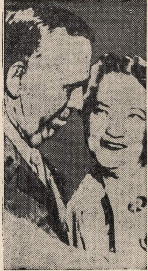
Gen. George C. Marshall, naujai paskirtas valstybės sekretorius, Hawajų salose susitinka su savo žmona. Gen. Marshall grįžta iš Kinijos.