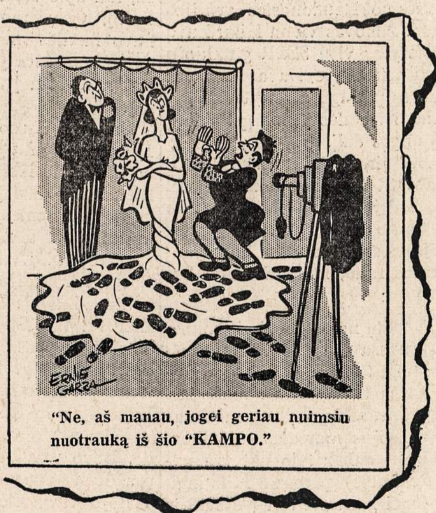
"Ne, aš manau, jogei geriau, nuimsiu nuotrauką iš šio "KAMPO."

Atđara kasdien nuo 9 ryto iki 5 vakaro. Ketvirtadieniais nuo 9 ryto iki 8 vakaro, šeštadieniais nuo 9 ryto iki 1 po pietų.