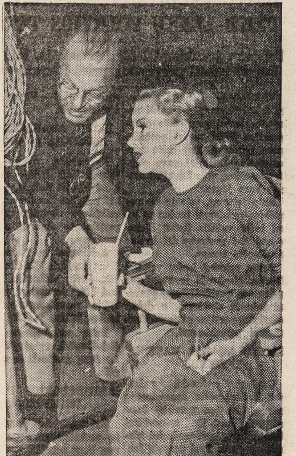
JUDY GARLAND has time for a quick malted milk between sequences during the shooting of M-G-M's musical life of Jerome Kern "Till the Clouds Roll By."