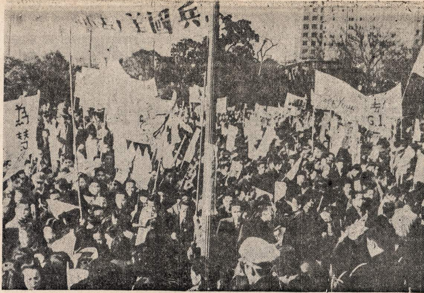
Dalis 6,000 kiniečių studentų, kurie Peipinge surengė demonstraciją prieš Amerikos marinas. Studentai tvirtina, kad Kalėdų išvakarėse vienas marinas išprievarė taves kinietę.

Be to, teko praeiti gana didelę gyvenimo mokyklą, kurios pamokos yra nei kiek ne prastesnės už pamokas mokyklos suole. Galį sakyti, kad mokinuosi jau septyniasdešimt metų, — ir reikia pripažinti, kad retam tenka taip ilgai mokytis, — o