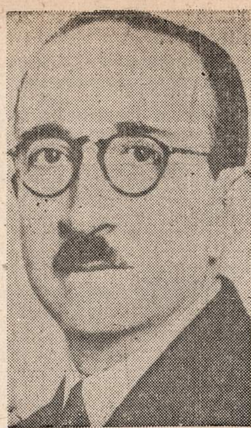
Visas Peru respublikos prezidento Rivero kabinetas rezignavo ryšyje su redaktoriaus Garland nužudymu.

kaimynei Elstahler, kad aš mokausi vokiškai. Vos tiktaip aš spėjau pas ją užbėgti, ji tuojau manęs ir užklusė: