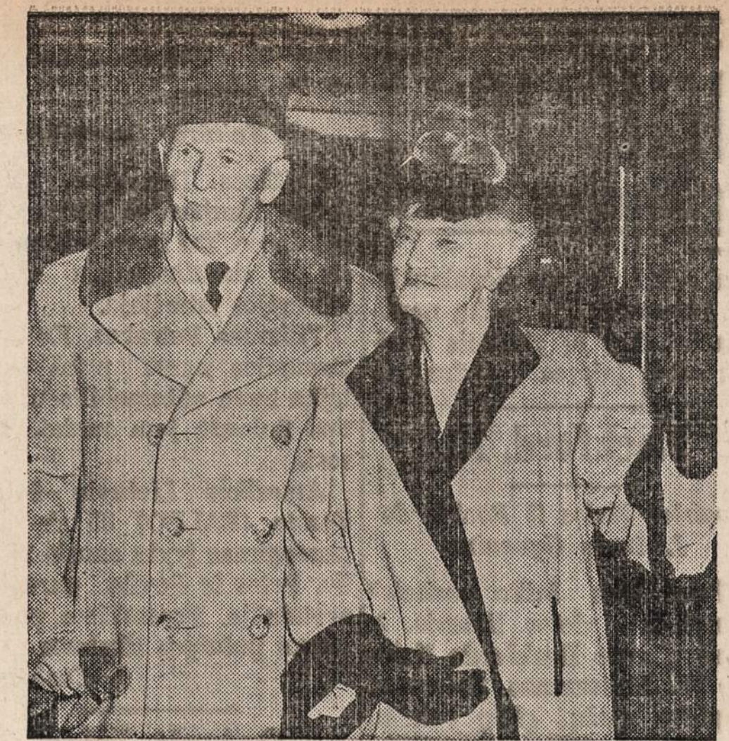
Generolas George C. Marshall su žmona Chicagoje lipo į traukinį. Dėl blogo oro jų lėktuvas buvo priverstas nutūpti Chicagoje, iš kur jie išvyko į Washingtoną traukiniu.

Dabar, fašizmui susmukus, bolševikišką diktatūrą Stalinas