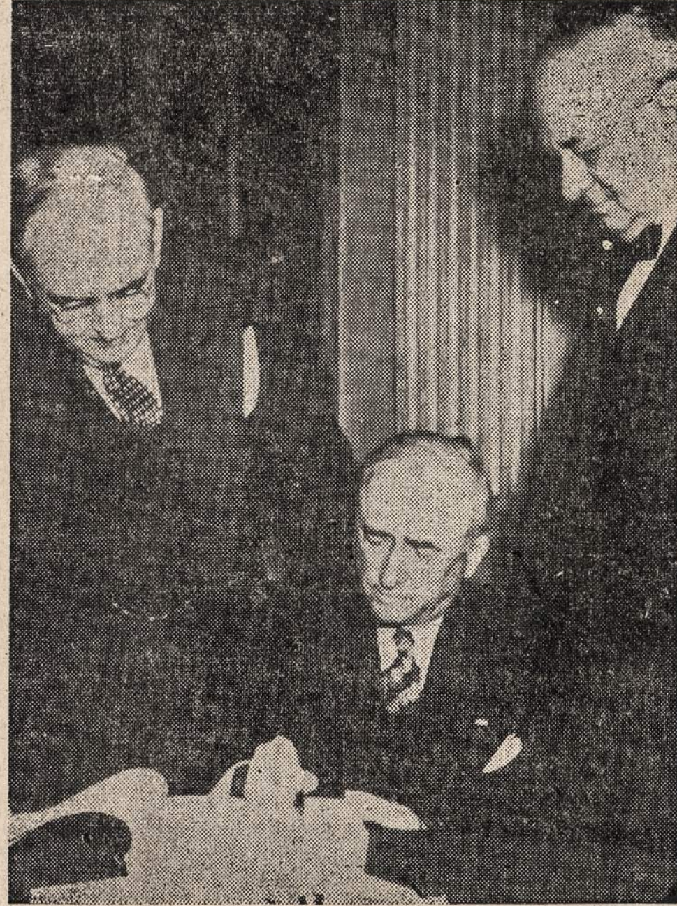
James Byrnes prieš pasitraukdamas iš valstybės sekretoriaus pareigų pasirašo Italijos taikos sutartį ir rengiasi pasirašyti taikos sutartis su Rumunija, Bulgarija ir Vengrija. Senatorius Vandenberg (po kairei) ir sen. Tom Connally yra lyg ir liudininkai.