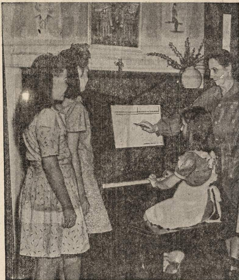
A Red Cross volunteer worker teaches music to youngsters in a Children's Home—a new phase of Red Cross work. Programs of instruction are now being brought to civilian hospitals, orphanages, and homes for the aged through Red Cross Arts and Skills Corps.