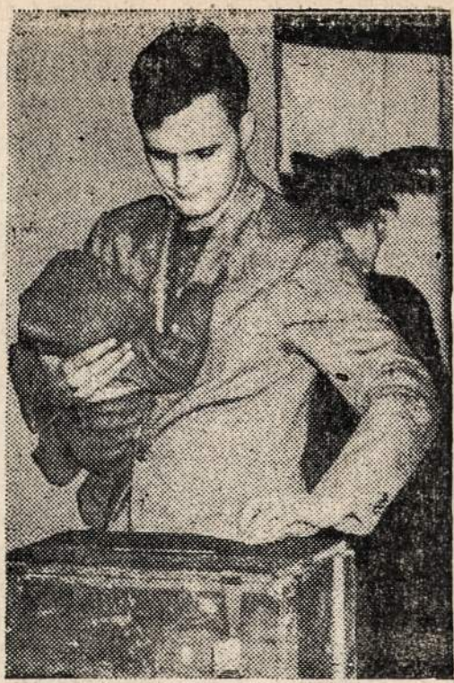
NAUJENŲ-ACME TŪPŪFOTO Allis-Chalmers dirbtuvės

Nors "Birutės" choras ir švenčia 40 metų sukaktį, bet iš senesnių laikų, galima sa-