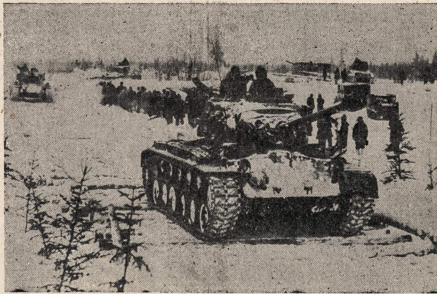
Ledo tiltas Alaskoje. Tiltas randasi netoli Fairbanks. Per jį gali važiuoti vidutinio didumo tankai.