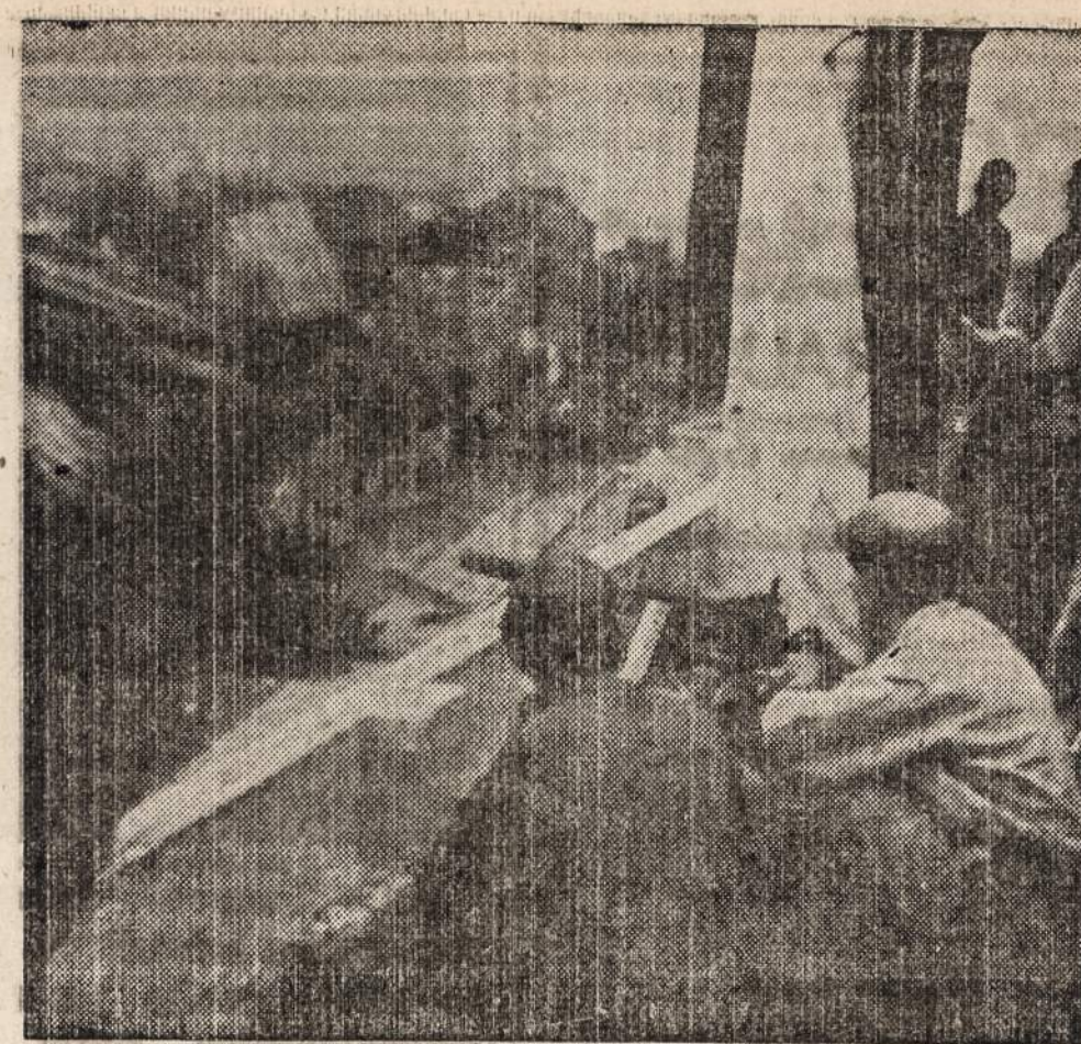
Prancūzų Indo-Kinijoje, kaip atfodo, prancūzų kariuomenė naudoja Amerikoje pagamintus ginklus.

Bibliografijos Istaiga suregistravo iš vedamų kartotekų periodikos straipsnių tematiką. Praeitais metais suregistruota 638, šiomet net 1748 straipsniai. Vyrąja literatūra (ėilė-raščiai, apysakos, jumoroskos, prozos veikalėliai — mažiausia): pr. metais — 58,9%, šiomet 46,9%. Social. mokslams (daugiausia publicist. straipsn. politikos klausimais) tenka skirti: pr. m. 17%, šiomet — 22%. Atsiminimų ir biografijų šiomet paskelbta spaudoje 8,1%, pr. m. buvo tik 4,9%. Šiomet daugiau rašoma religinėmis te-