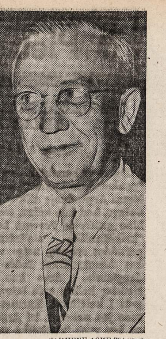
Oscar Rennebohm, kuris Madison, Wis., turi kelias aptiekas, užėmė Wisconsin gubernatoriaus vietą, kai mirė gubernatorius Walter S. Goodland. Iki šiol Rennebohm ėjo leitenanto gubernatoriaus pareigas.