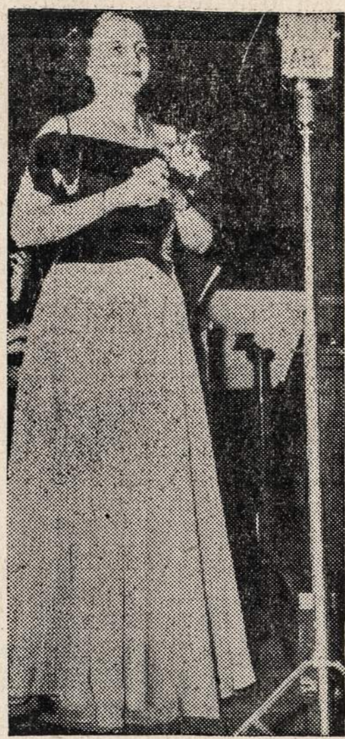
Margaret Truman, prezidento duklė, prie mikrofono. Ji dainavo iš Detroito radijo stoties. Radijo klausytojai turėjo progos girdėti, kaip prezidento duklė dainuoja.