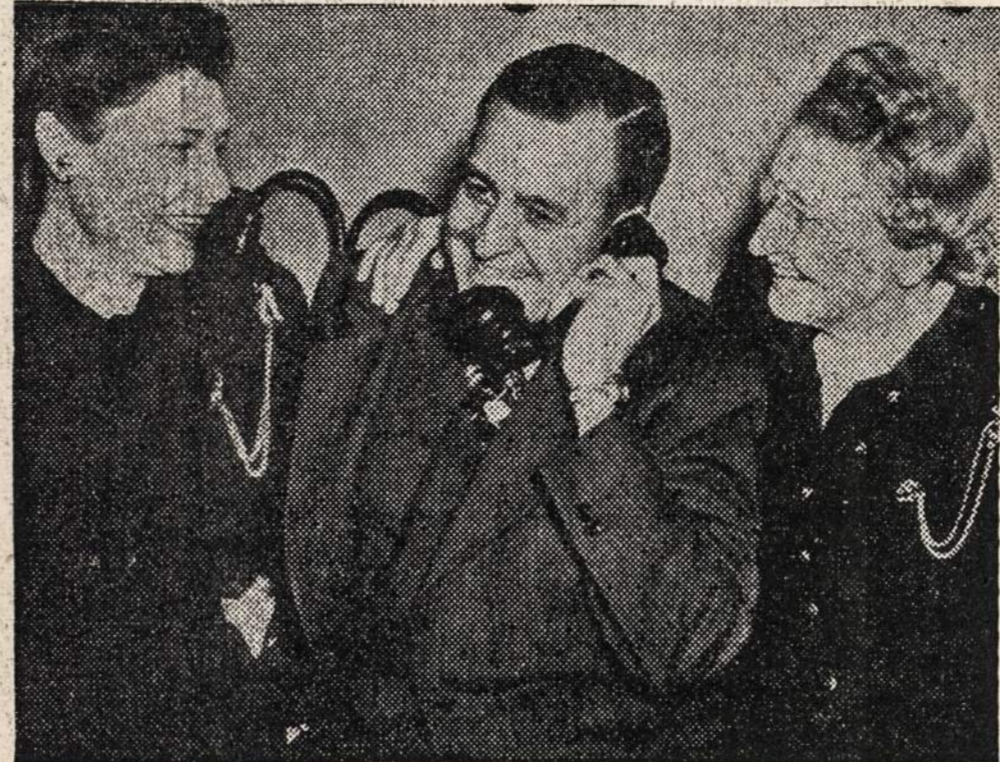
M. E. Thompson (viduryje) yra sveikinamas per telefoną Atlanta mieste po to, kai valstijos vyriausias teismas paskelbė jį Georgia gubernatoriumi. Su Thompson yra jo motina (po dešinei) ir jo žmona.