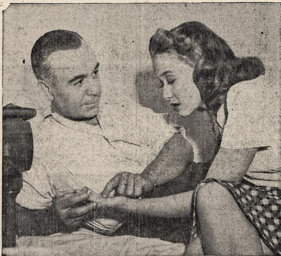
JANE POWELL finds Jose Iturbi's knowledge of palmistry fascinating. The noted pianist and orchestra conductor predicts a brilliant career on the screen for the young prima donna, a prediction which she assured in "Holiday In Mexico." Jane and Iturbi will appear together once again in M-G-M's forthcoming "The Birds and the Bees."