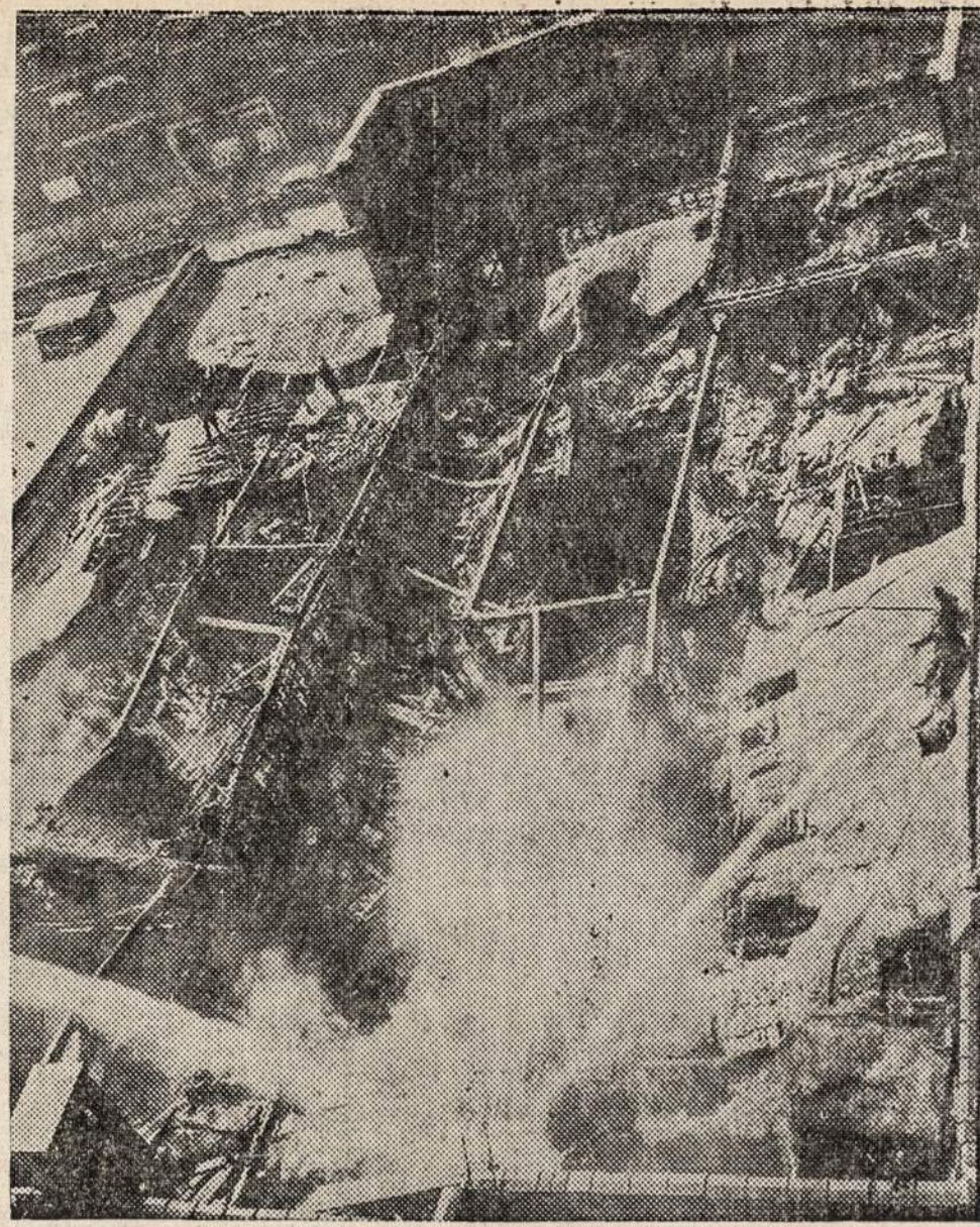
Central National bankas Chicagoje (prie Halsted ir 12-tos), kuris skaudžiai nukentėjo dėl gaisro. Ap-skaičiuojama, kad nuostoliai sieks $250,000. Pinigai ir vertybės popieriai ugnies nebuvo paliesti.