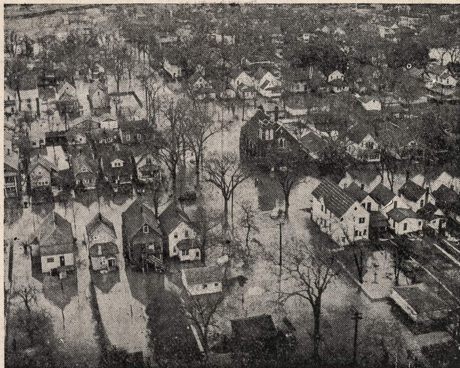
Ši nuotrauka buvo padaryta iš oro. Ji vaizduoja Chicagos apylinkę (Markham), kuri balandžio 5 d. buvo vandens apsemta.