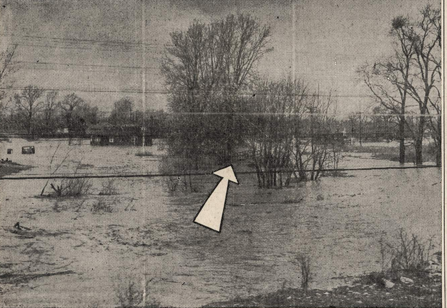
Šis paveikslas buvo nutrauktas iš einančio traukinio lango. Tai vaizdas Chicagos apylinkės po nepaprastos liūtis balandžio 5 d.

Pirkite tose krautuvėse, kurios garsinasi "NAUJIEOSE"