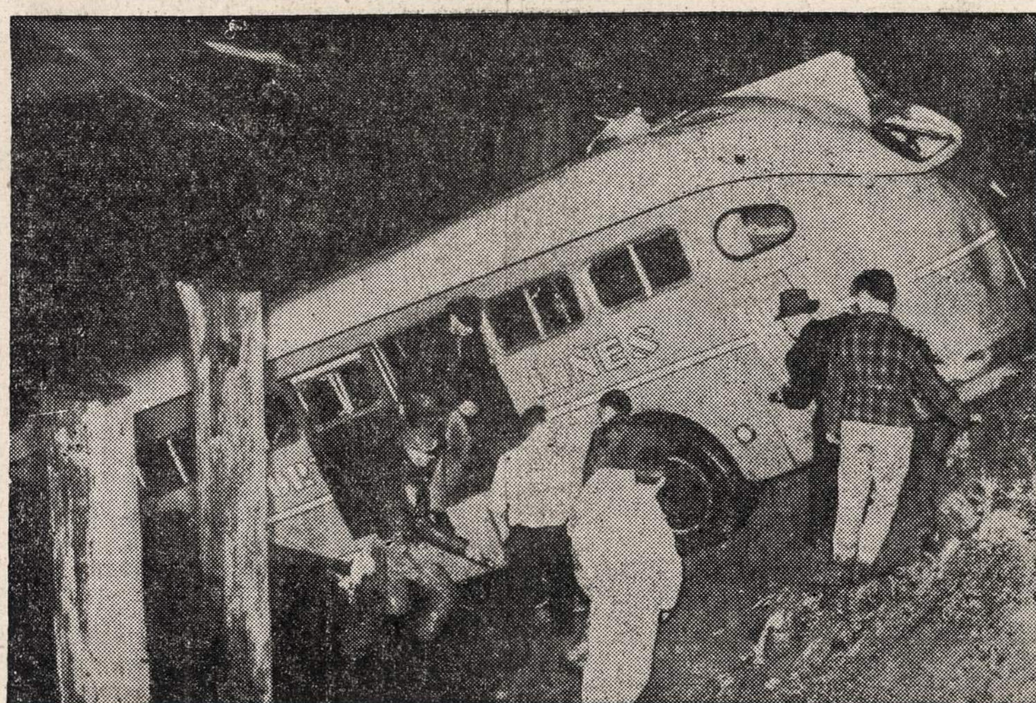
Aštuoni žmonės žuvo ir 10 buvo sužeisti, kai busas atsimušė į trokš, o po to nusirito į Duwamish upę netoli nuo Seattle, Wash.