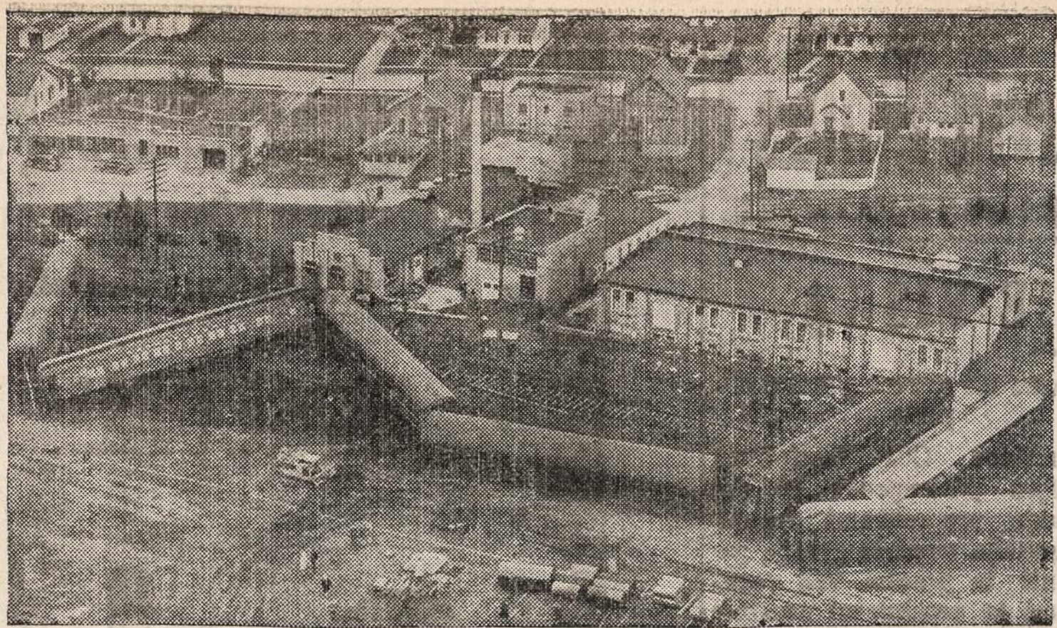
COLUMBIA CITY, Ind. — Traukinys nušoko nuo žmonių nukentėjo, bet tik keturi iš jų buvo tiek sunkiai sužeisti, kad juos teko ligoninę gabenti.

Kongresas, žinoma, jo už tai nepaglostys. Už kongreso paniekinimą atsakant duoti jam parodymus komunistas gali gauti metus kalėjimo; o už samokslą pasitytioti iš kongreso jisai gali gauti dvejus metus. Bet įdomu, kas to pauksčio praityje slepiasi, kad jisai taip užsikirto?