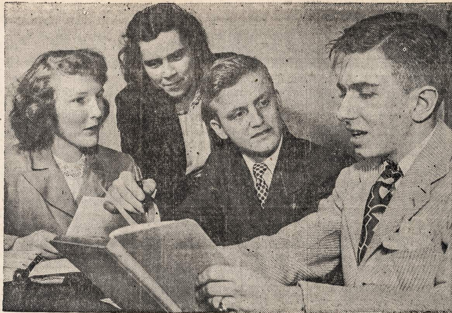
West Rockford aukštesnės mokyklos jaunuoliai, kurie Illinois universitete laimėjo debatų kontestą.

"NAUJENAS" SKAITO VIŠU SROVIŲ ŽMONES: DARBININKAI, BIZNIERIAI, PROFESIONALAI, DVASININKAI, VALSTYBININKAI, MOKSLININKAI. JIE ŽINO, KAD NAUJENOS PADUODA TEISINGIAUSIAS ŽINIAS IR GERIAUSIUS RASTUS.