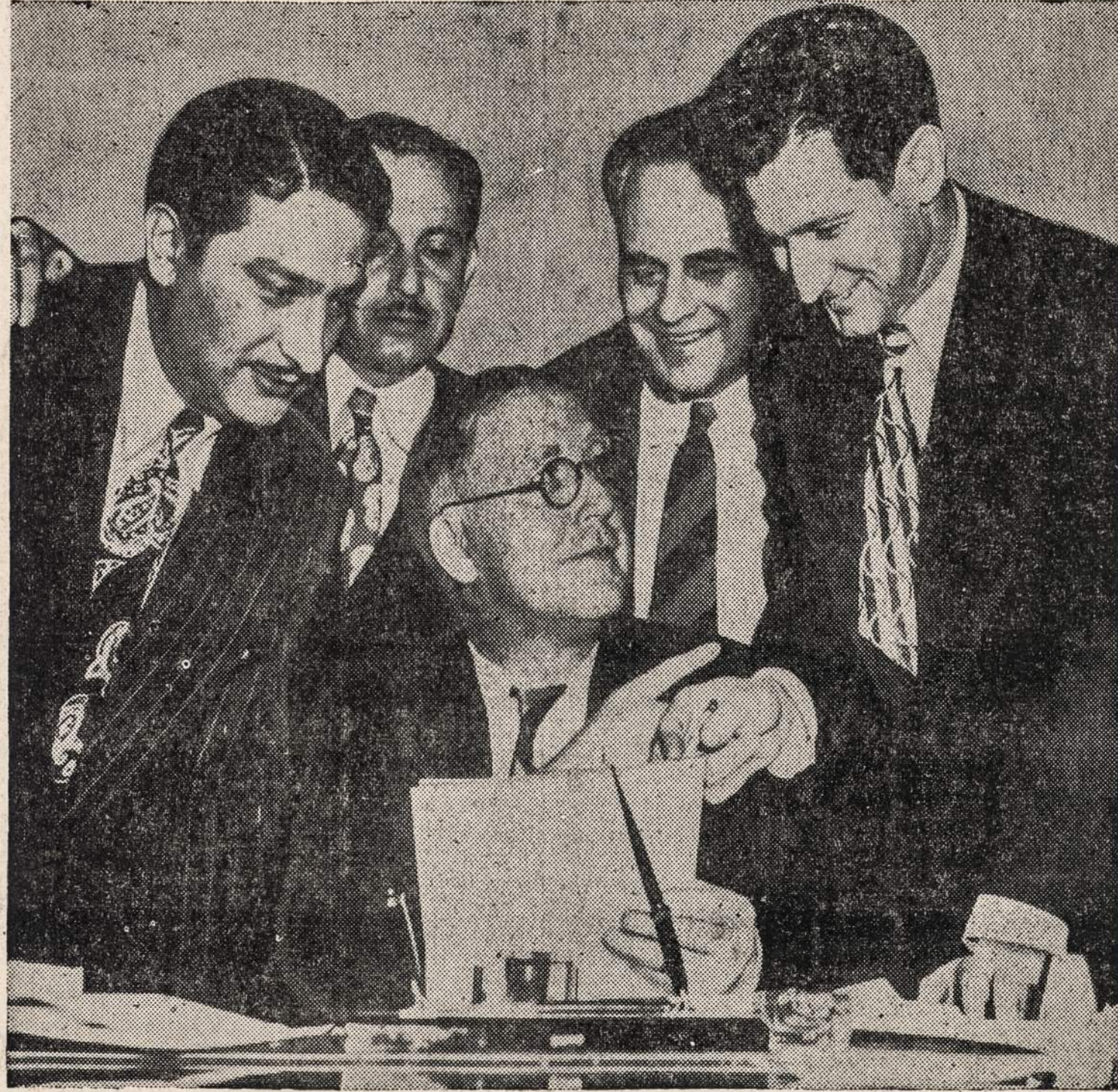
Darbo sekretorius Lewis B. Schwellenbach (sėdi) laiko spaudos konferenciją Washingtono ryšyje su telefono įmonių streiku.