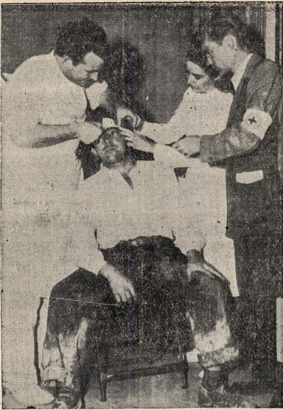
SAUJENU-ACME Telefonai TEXAS CITY, Tex. — Raudonojo Kryžiaus darbininkai įrengė kliniką kalėjime.

pareiškė, kad ateity, per dvejus metus, jis vesiąs kampaniją ir vartosis savo dainas tiesiogiai politinei akcijai prieš fašizmą Amerikoje.