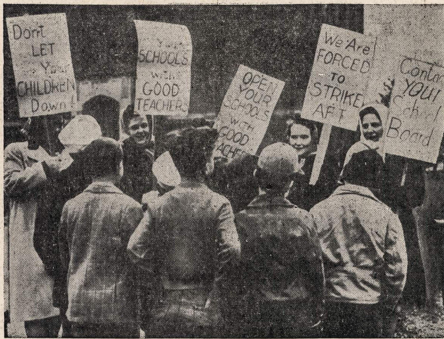
EAST DETROIT, Mich. — Grant mokyklos mokiniai skaito iškasbas, kurias neša streikuojantys mokytojai, ir atsisako eiti per pikietininkų eilę. Mokytojai reikalauja algų pakėlimo.