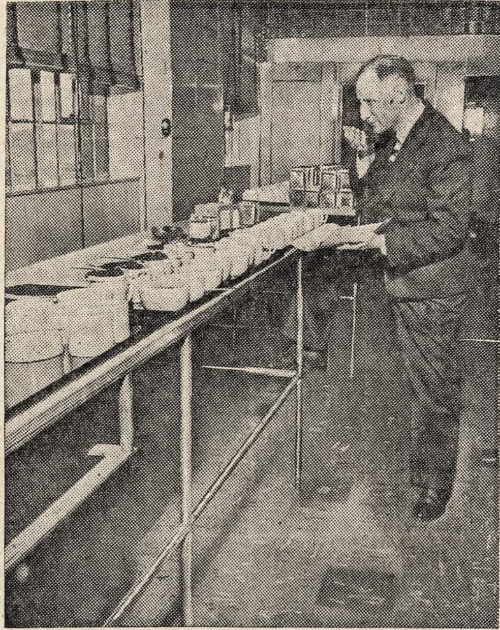
Before the tea is brewed, a sample of dry leaves is examined by the tea taster. The sample is judged by sight, feel and smell. In these tests the expert determines the qualities of flavor and aroma of the tea that go into various blends.