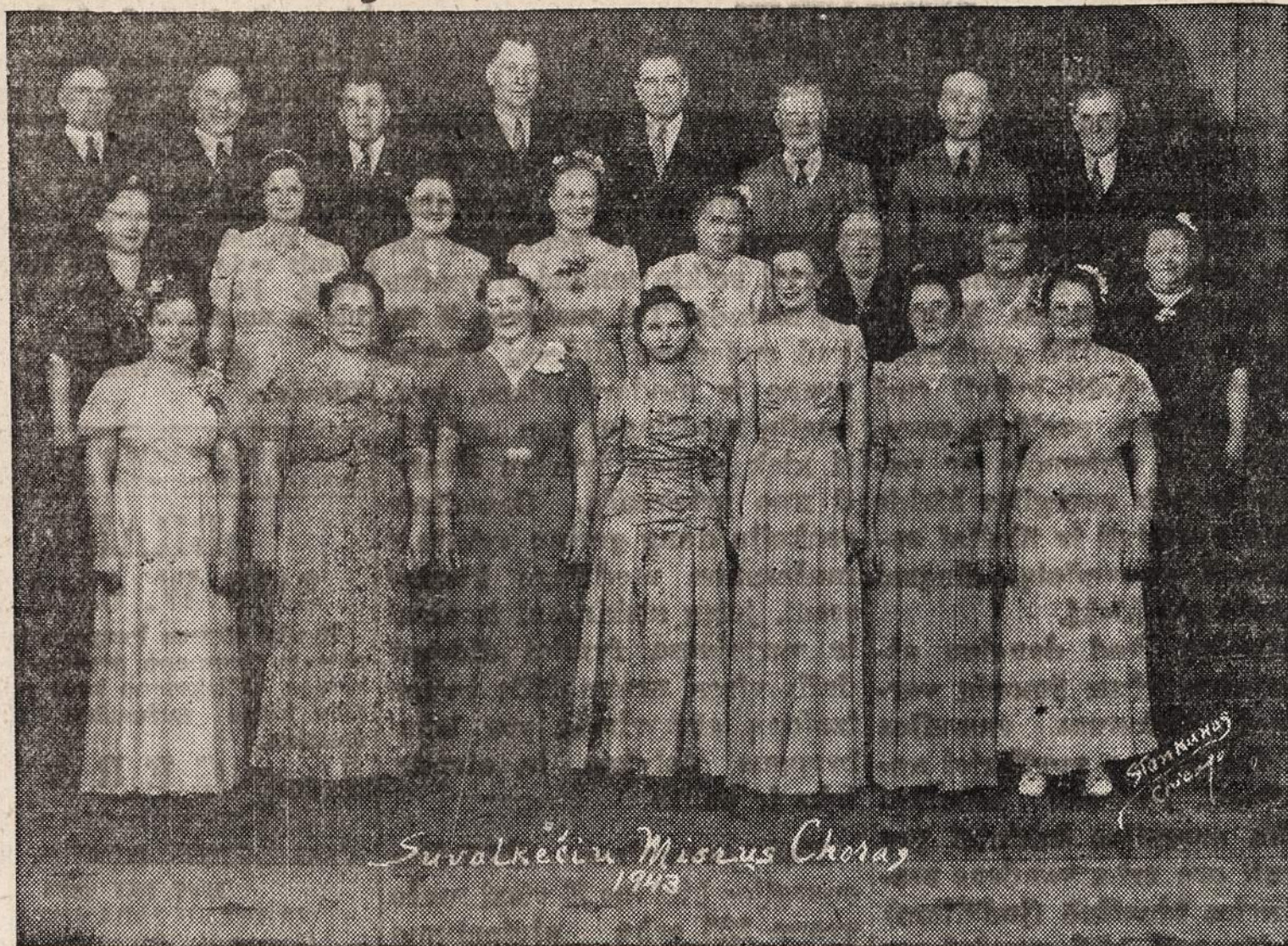
Priduota $100.50 Tarybos Sekretoriui

Suvalkiečių Mišrus Choras rengė vakarą balandžio 27 dieną šv. Jurgio parapijos svetainėje. Buvo suvaidintas veikalas "Mirtis žiaurais karaliaus".