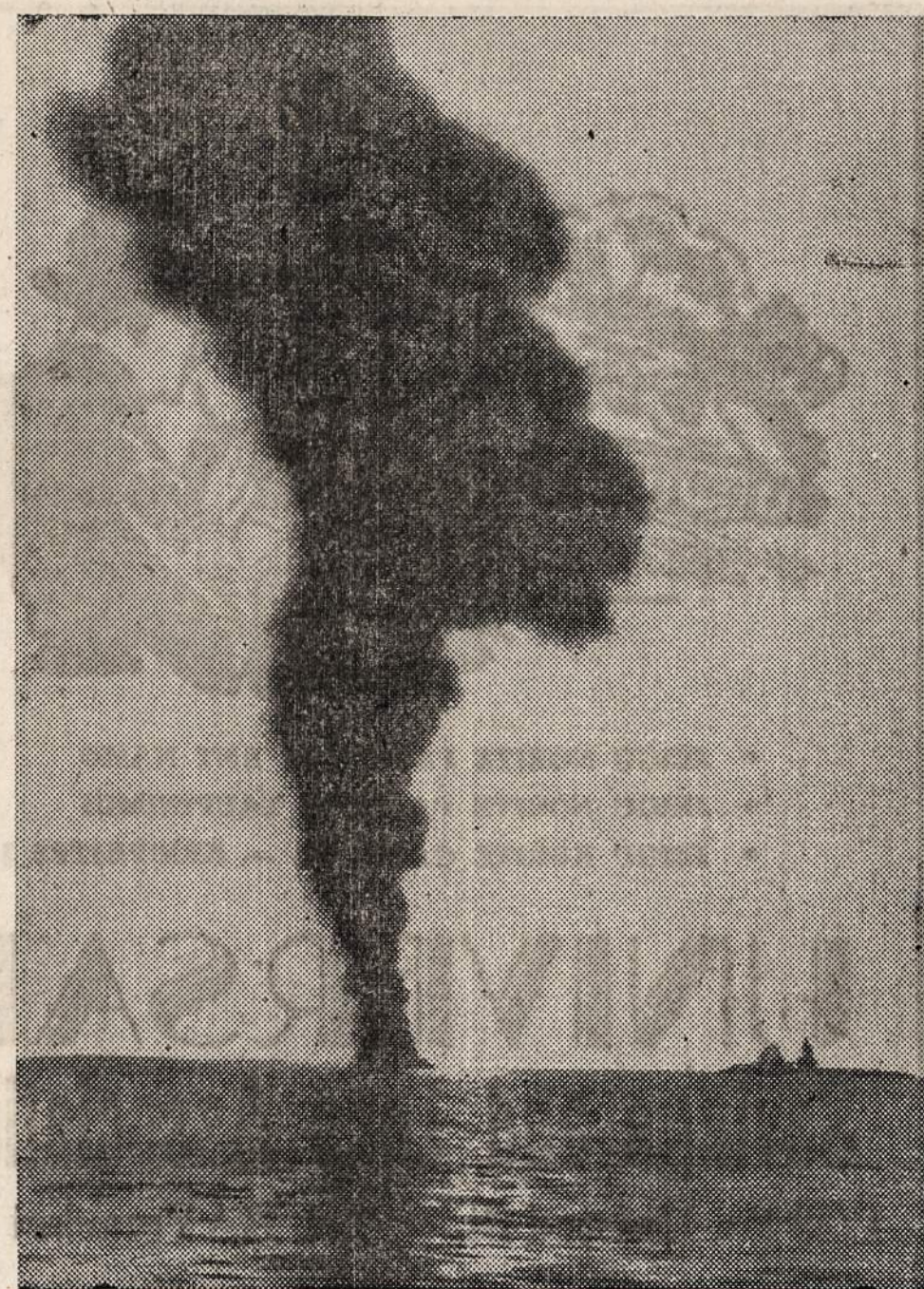
Sis paveikslas vaizduoja, kaip netoli Cape May (N. J.) nukrito į jūrą lėktuvas. Nelaimėje žuvo keturi žmonės.