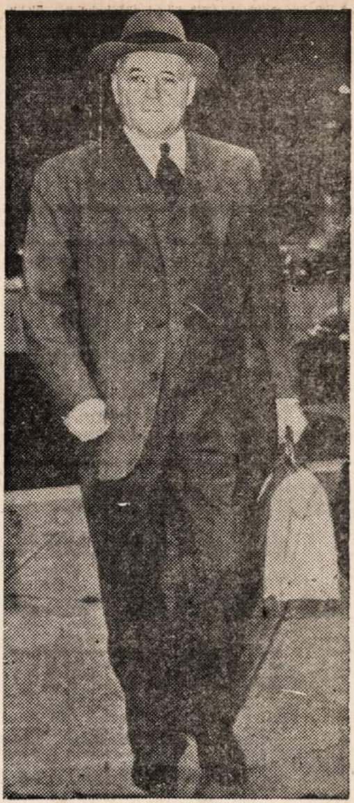
ŠALPŲ FONDUI VAJAUS ATIDARYMO ISKILMES GEGUZES 11 DIENA, DARIAUS-GIRENO SALEJE