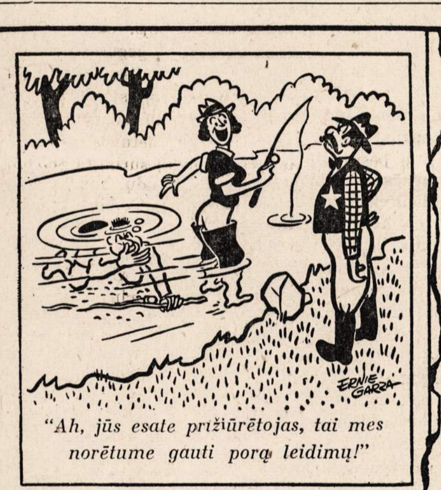
„Ah, jūs esate prižiūrėtojas, tai mes norėtume gauti porą leidimų!“

NAUJIENOS 1739 SOUTH HALSTED STREET, CHICAGO 8, ILLINOIS