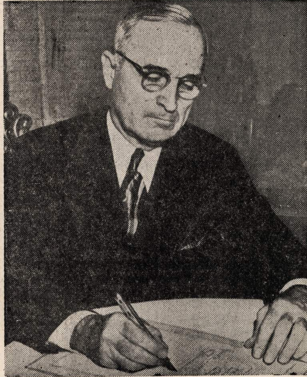
Prezidentas Trumanas pasirašo Graikijai-Turkijai teikimo pagalbos bilį Muehlebach vieřbutyje, Kansas City, Mo.