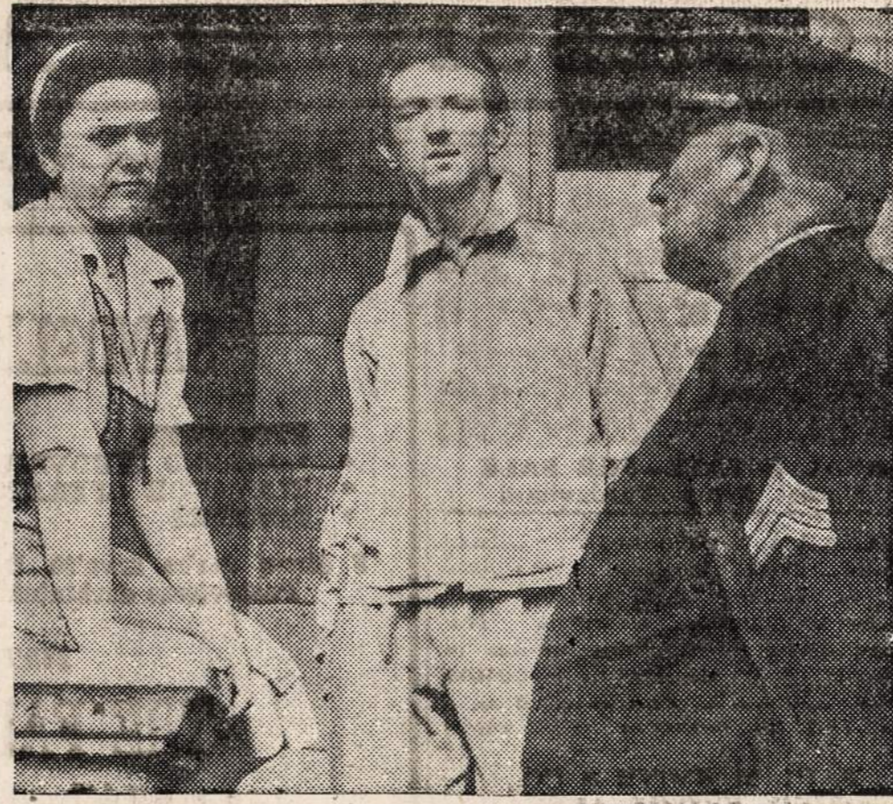
MILWAUKEE, Wis. — A. Andrew pasakoja policijos seržantui, kaip atrodė kriminalistas, kuris išprievaravo penkių metų mergaitę.

— Senatas nutarė leisti namų savininkams pakelti nuomą 15%, jeigu jie gertoju susitaria su nuomotuju.