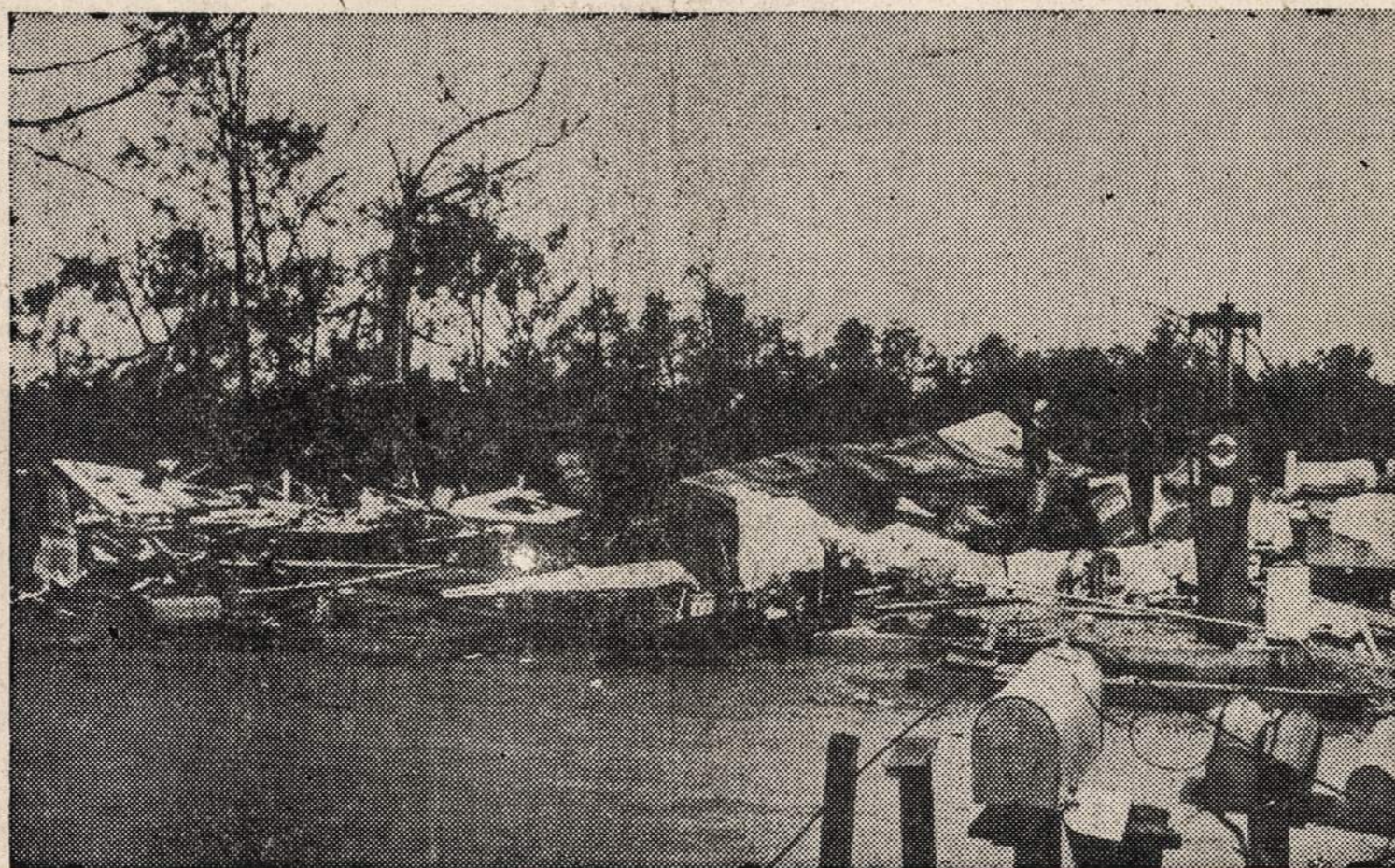
UNION, Ark. — Viskas, kas liko iš krautuvės, kurią sunaikino viesulas. Arkanzas valstijoje siautęs viesulas užmušė 37 žmones ir kelis šimtus sunkiau ar lengviau sužeidė.