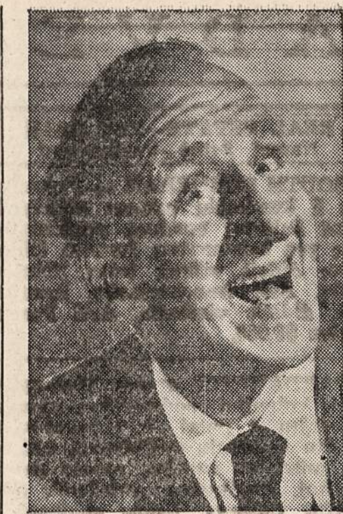
Jimmy Durante