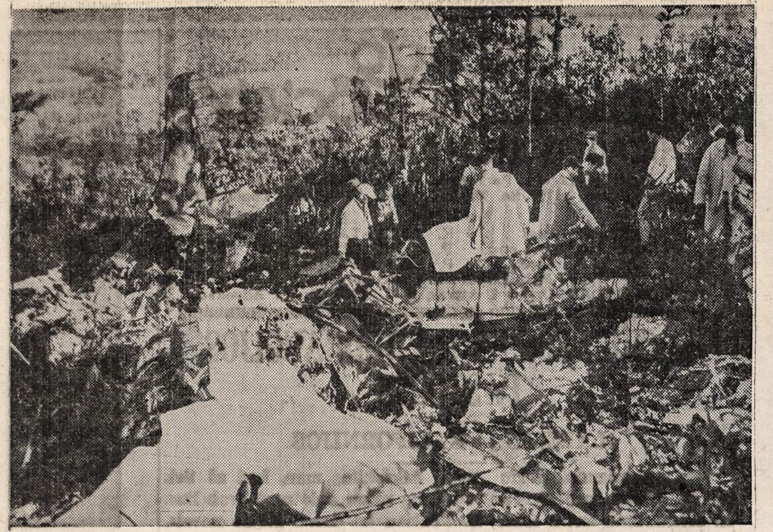
LEESBURG, Va. — Prie suduzusio lėktuvo, kuris atsimušė į Blue Ridge kalnus. Nelaimėje žuvo 50 žmonių.