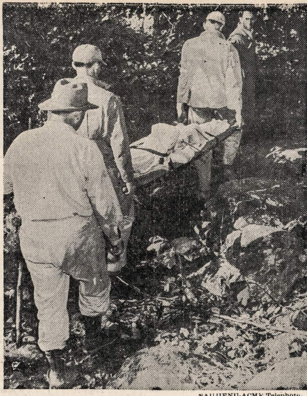
LEESBURG, Va. — Sudužusio lėktuvo auka. Iš viso skrido 50 žmonių, ir jie visi žuvo, kai lėktuvas atsimušė į kalną ir susidaužė.

Kiek galima numanyti, tai vedybos bus nepaprastai didelės ir šaunios.