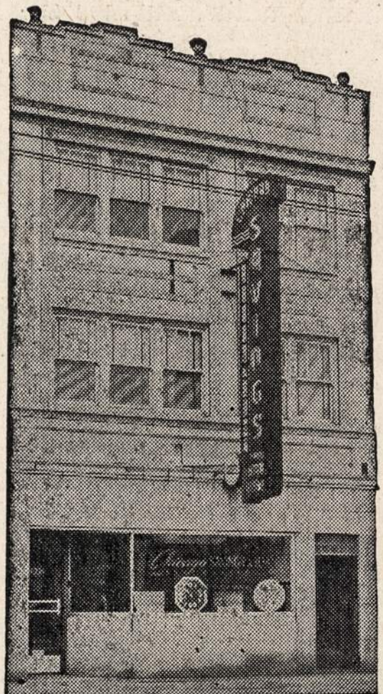
NAUJAS BENDROVĖS NAMAS

6234 S. Western Avenue Phone GROVE HILL 7575