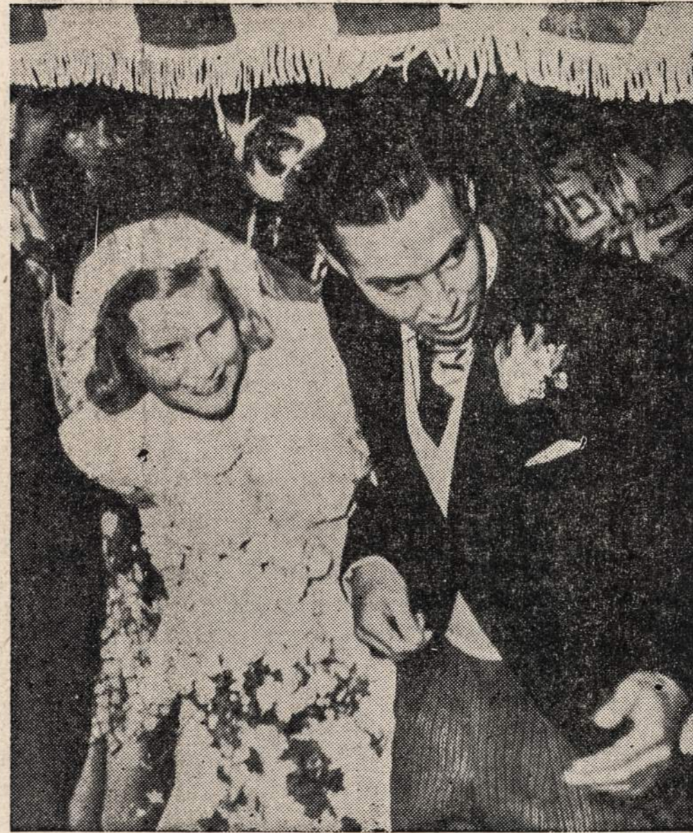
William Clay Ford su savo jaunavede apeidžia St. Paul's katedrą Akrono po vedybų ceremonijų. Jis vedė Firestone (gumos magnato) dukterį.