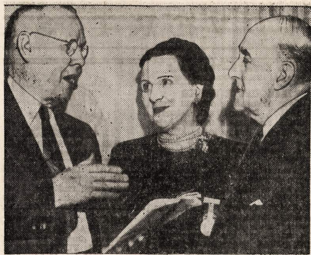
William L. Green, Amerikos Darbo Federacijos prezidentas New Yorko Darbo Federacijos konvencijoje pasakė kalbą, kurioje jis griežtai pasmerkė prieš unijas išleistą įstatymą.

"KELEIVIS" 636 Broadway SO. BOSTON, MASS.