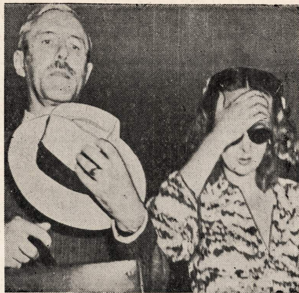
AREŠTUOTA ANGLŲ KARALIAUS SESERČIA

Parasėme keletą atvirukų chicagiečiams, bet jų išsiųsti