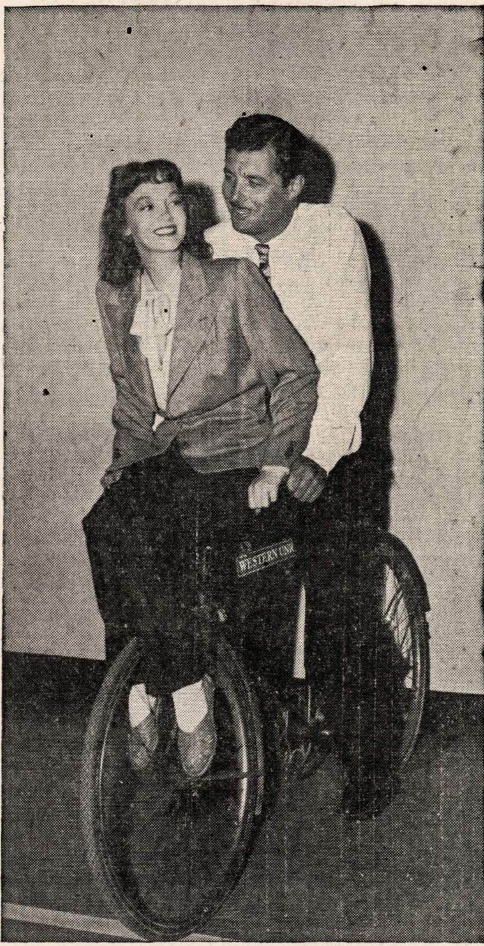
JAMES CRAIG pedals Lucille Bremer between sound stages during the filming of M-G-M's forthcoming film, "Dark Delusion." And nice pedaling it is, too! Aside from the bicycling duo, the picture stars Lionel Barrymore.