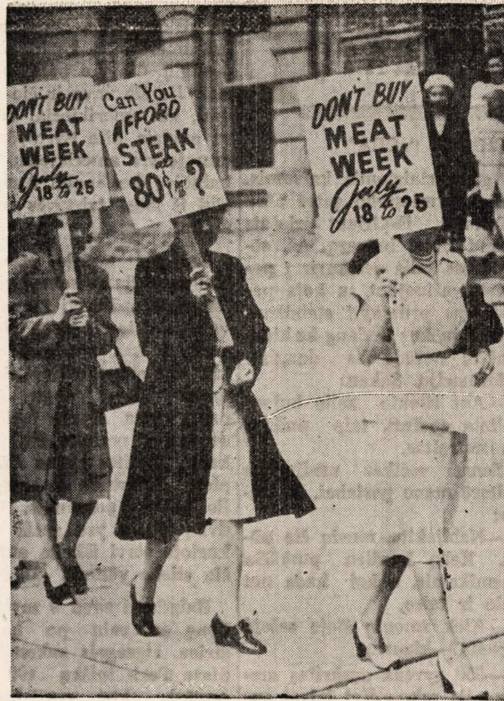
NAUJIENU-ACME Telephone CIO pagalbinė organizacija piktuoja Detroito miesto rotušę, protestuodama prieš kylančias kainas mėšiai.

—Ateinantį šeštadienį Kongreso knygyne bus atidarytos dėžės, turinčios 14,000 įvairių Abrahamo Lincolno dokumentų ir laiškų. Iki šio meto publikai buvo uždrausta juos vartoti.