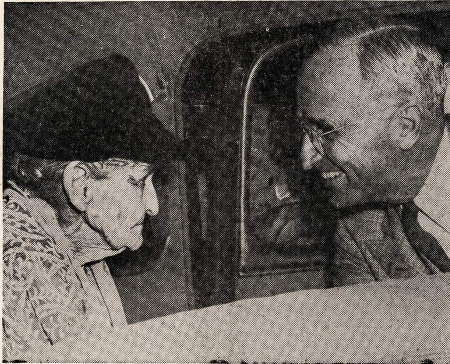
Prezidentas Trumanas su savo motina. Ši nuotrauka buvo padaryta tuoj po to, kai Demokratų partija jį nominavo kandidatu į vice-prezidentus.

jamus turto naikinimus ir kerštą olandų kariuomenėi. Salos gyventojai pasakoja, kad Indonezijoje netvarką kelia tikta olandai. Šiuos pranešimus kartoja Indijos radijo stotys.