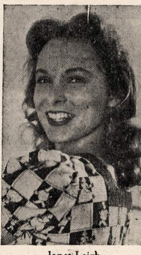
Janet Leigh

Šiandien yra pirmoji diena kai apie 9,000,000 karo veteranų gali iškeisti savo bonus į pinigus. Visa bonų suma siekia daugiau, negu $2,000,000,000.