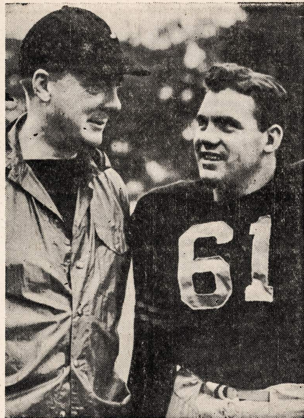
Kariuomenės sportininkai tariasi apie naujo sezono planus.