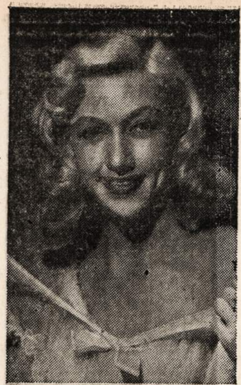
Gloria Grahame