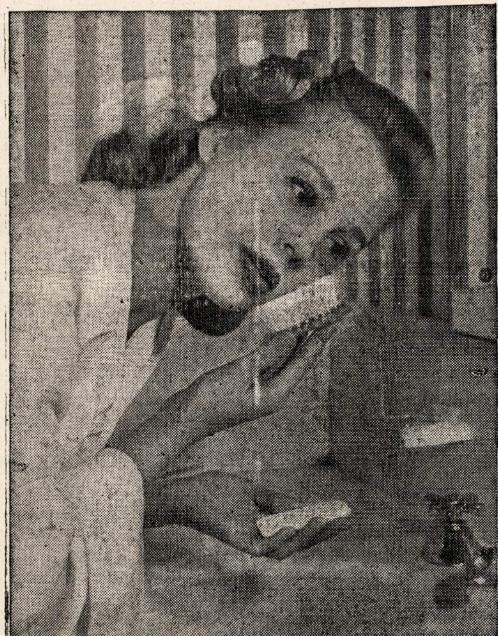
SOAP AND WATER, several times a day, applied with a complexion brush is June Allyson's recipe for lovely skin. Above all, she never forgets to remove all make-up before going to bed. Famed for her natural beauty, June will be seen next in M-G-M's forthcoming musical, "Good News."