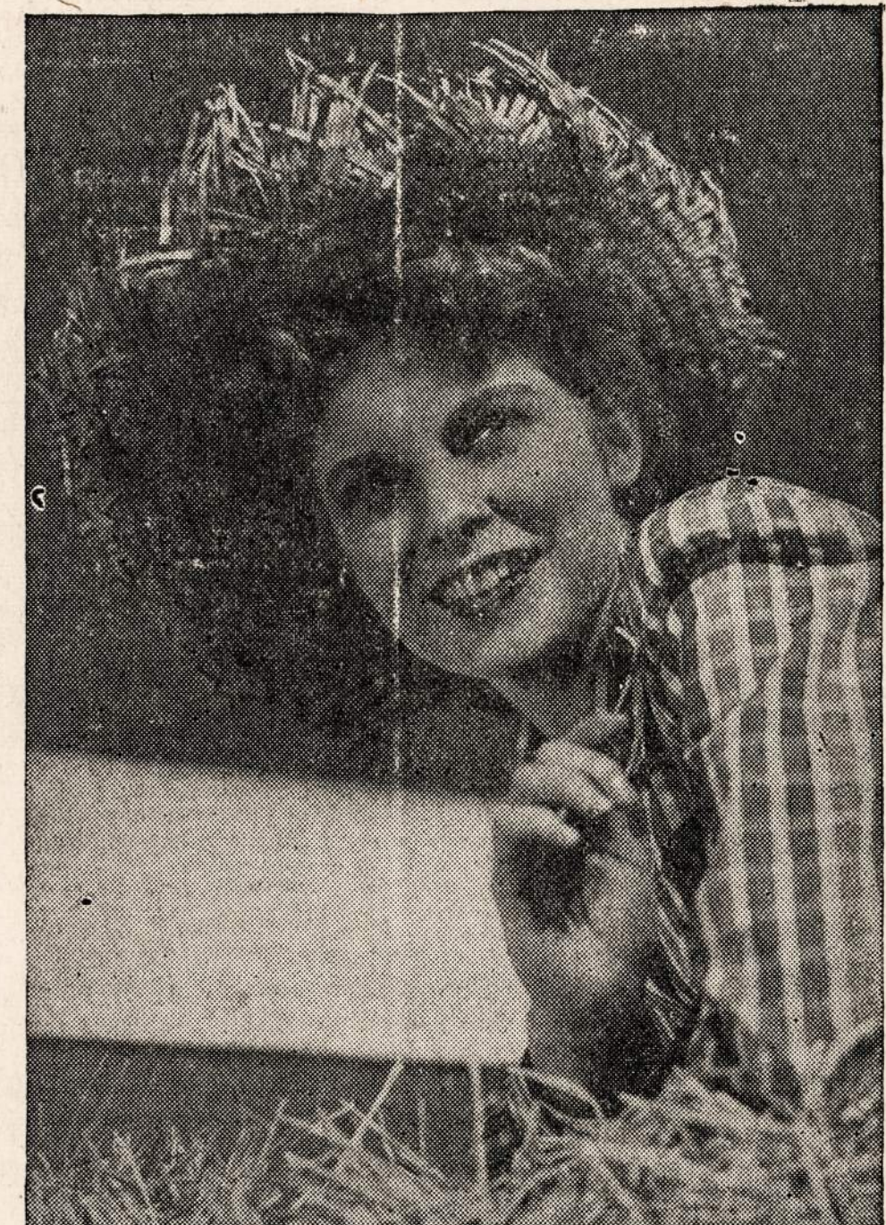
A SCREEN NEWCOMER, Janet Leigh was, until last summer, a student at the College of the Pacific. Discovered by Norma Shearer, she won a lead in her very first picture, "The Romance of Rosy Ridge," in which she makes her debut opposite Van Johnson.