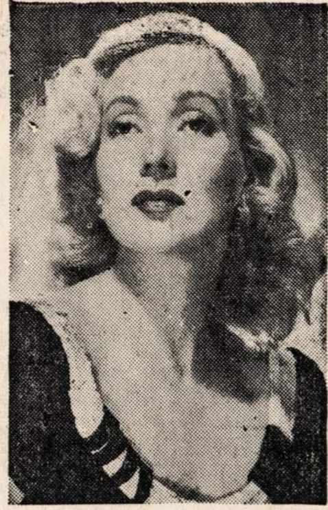
Ann Sothern M-G-M Star

Interstate Commerce Com- mission įgaliojo Chicago, South Shore and South Bend ir New York Central geležinkelius pakelti kainas bilietų važiuojan- tiems artimas keliones, t.y. į priemiesčius ir iš priemiesčių į Chicago.