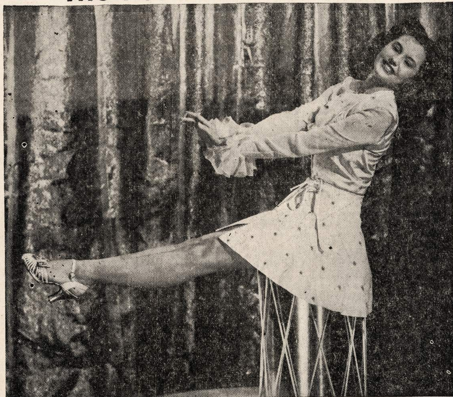
PREMIERE BALLERINA, Cyd Charisse, balances perfectly, and with ease on top of a drum that happened to be handy. The M-G-M actress is currently to be seen in "Fiesta," and will appear in the same studio's forthcoming "The Unfinished Dance," starring Margaret O'Brien.