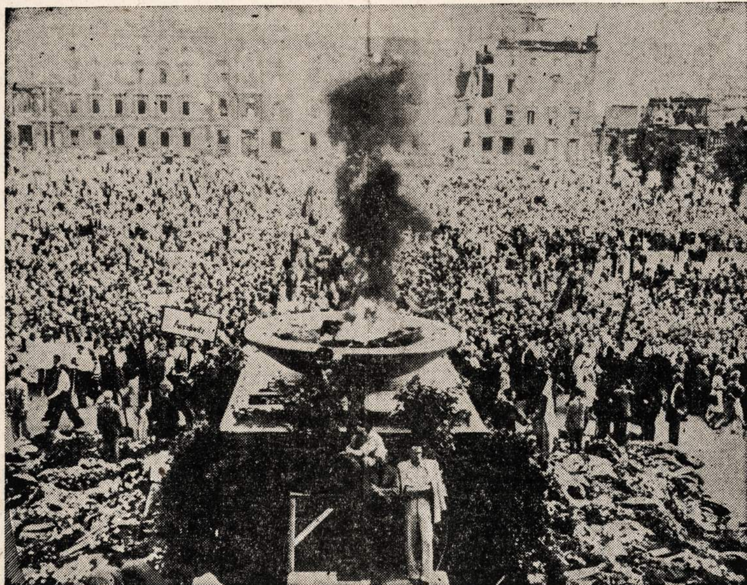
Į Lustgarteną susirinko daugiau negu 25,000 vokiečių, laikytų nacių koncentracijos stovyklose. Susirinkusieji vainikais ir kalbomis pagerbė stovyklose žuvusius fašizmo priešus.