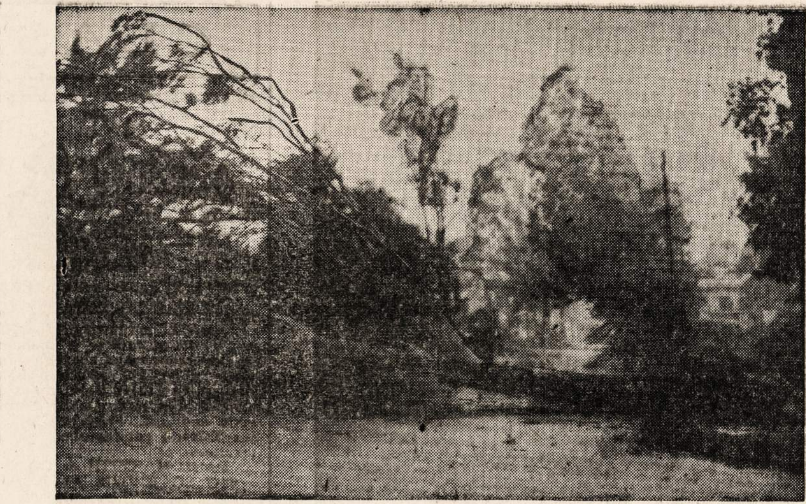
VAIZDAS FLORIDOJE PO PRAUŽUSIO URAGANO.

Šis mūsų rašytojų suvažiavimas taip pat nutarė išleisti į visą pasaulio literatus savo bendrą atsisveikinimą, kuriame būtų atpasakotos mūsų tautos ir valstybės gyvenimo sunkumai. Tenka spėti, kad toksai atsisveikinimas turės savo atgarsį.