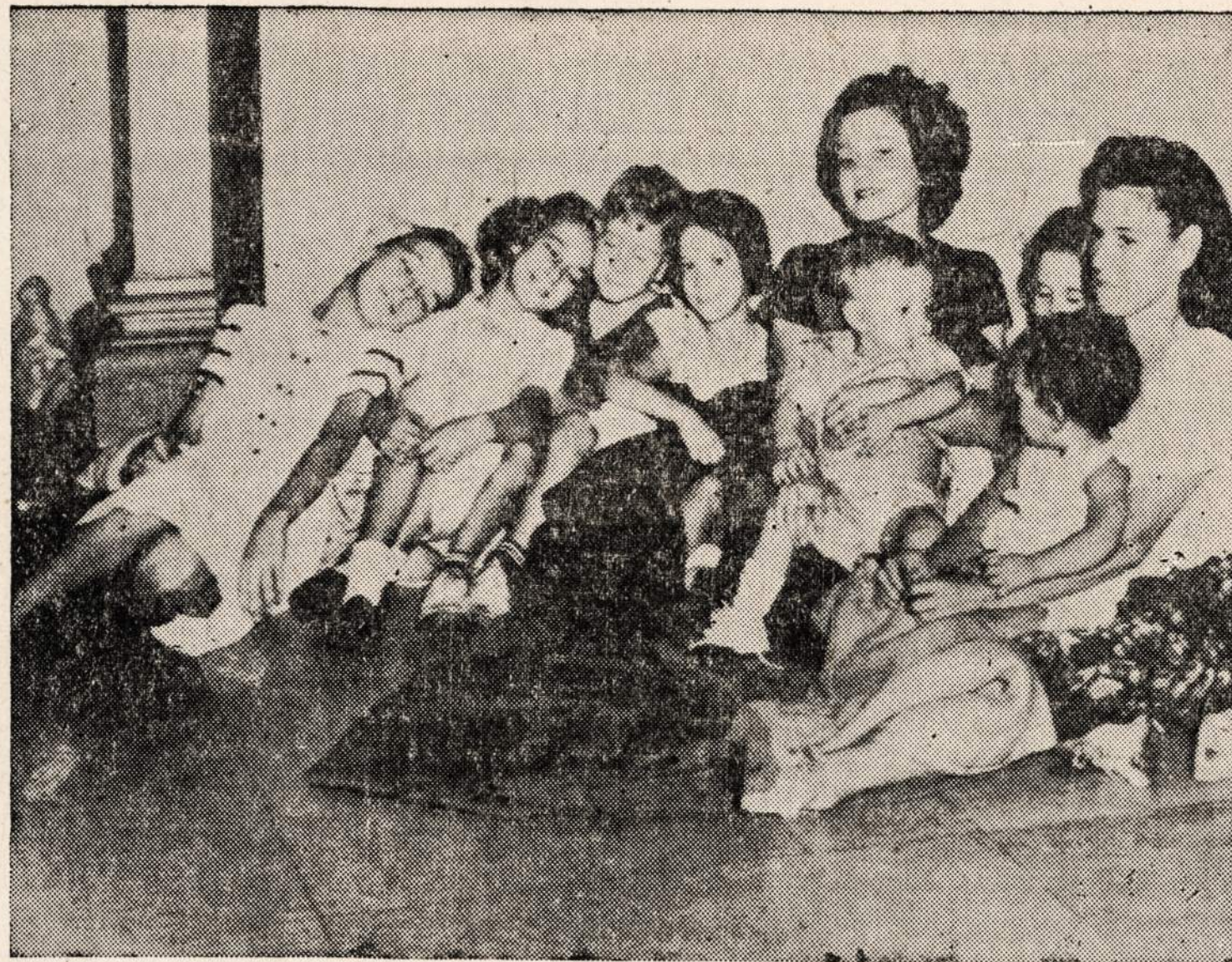
Kelios New Orleans šeimos uzbėgo į pašto įstaigą, kad galėtų apsaugoti nuo siaučiančio uragano. Beveik visi miesto langai buvo apkalti lentomis, bet saugiai žmonės galėjo jaustis tikai stipriuose pastatuose.

Rašytojai buvo mokomi kū-rybos taip, kaip kiti piliečiai bolsėvikių partijos istorijos. Po-sėdžiuose buvo vertinami nauji rašytojų, daugiausia pradedan-čių kūriniai. Ko iš kūrinių bu-vo reikalaujama, rodo pasmer-kimas vieno rašytojo (J. Gru-šo) novelės už tai, kad ūkinin-ko ir samdinio konfliktas joje