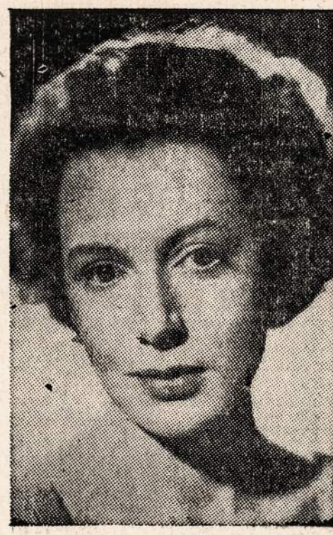
Deborah Kerr M-G-M Star

Kasdien vis daugiau išvyksta į darbus — būreliai vyrų ir moterų. Moterys daugiausiai vyksta į ligonines ir tekstilės fabrikus, vyrai — į žemės ūkį.