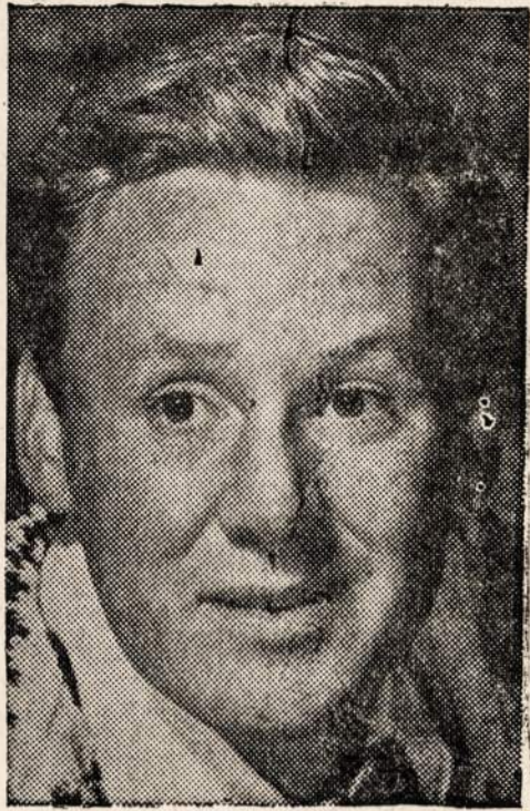
Van Johnson M-G-M Star

Bet tai, kaip sakoma, tik viena medalio pusė. Šandien yra gerai žinoma, kad nepalankus oras labai veikia ir žmogaus sveikatą. Tam tikrais atsitikimais staigi oro permaina tiesiog prisideda prie mirties pagreitimo. Nieko tad stebėtino, kad, bendrai imant, mirtingumas šią vasarą žymiai padidėjo. Padidėjo jis ir mūsų narių tar-