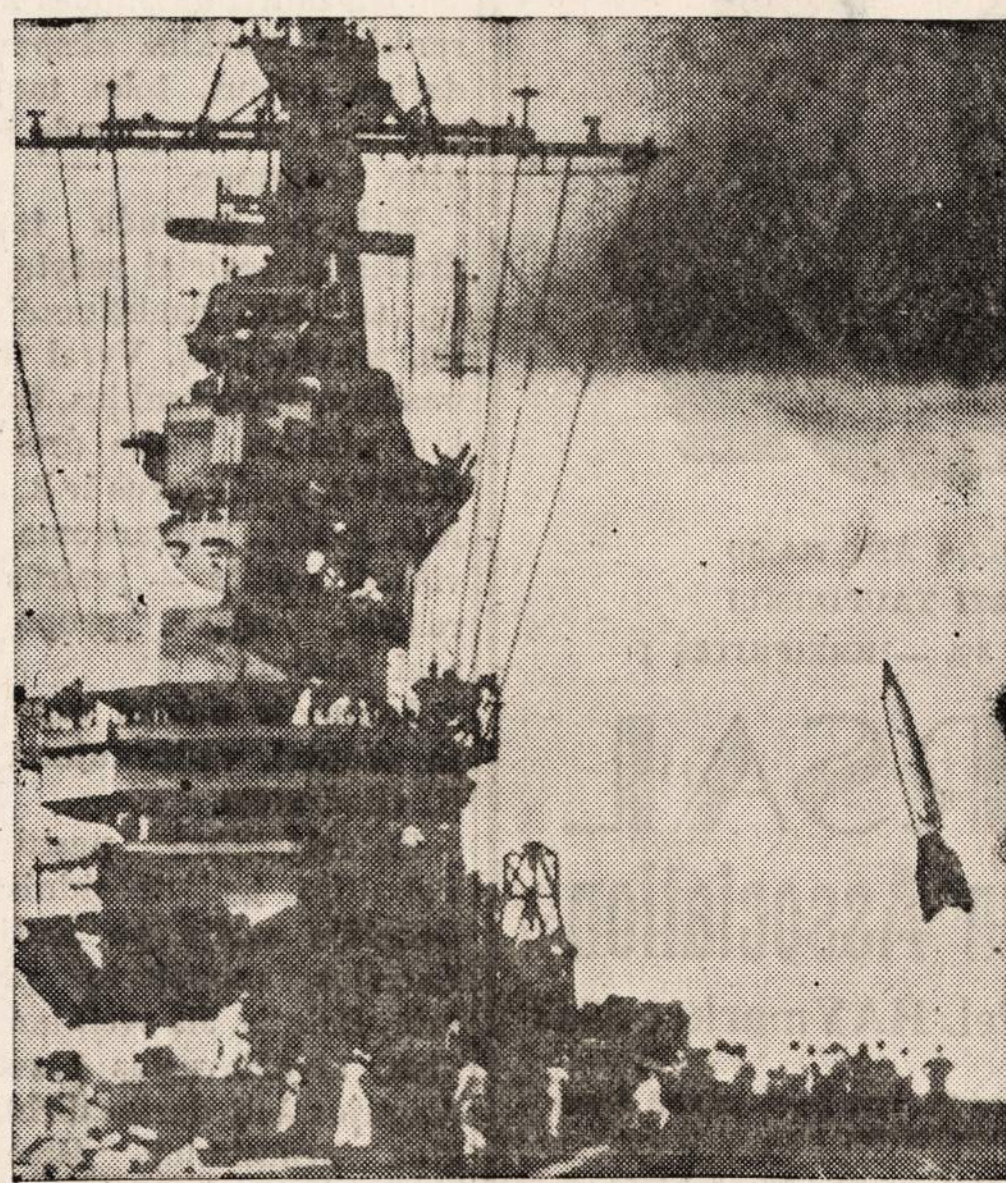
Pirmą kartą istorijoje iš vokiečių atimta V-2 raketa yra iššaukama iš Amerikos lėktuvnešio.

SEKMADIENI, Lapkričio 9 d., 1947 Pradžią 3:30 popiet SOKOL SALEJE 2337 S. KEDZIE AVE. Grieš du orkestrai šokiams.