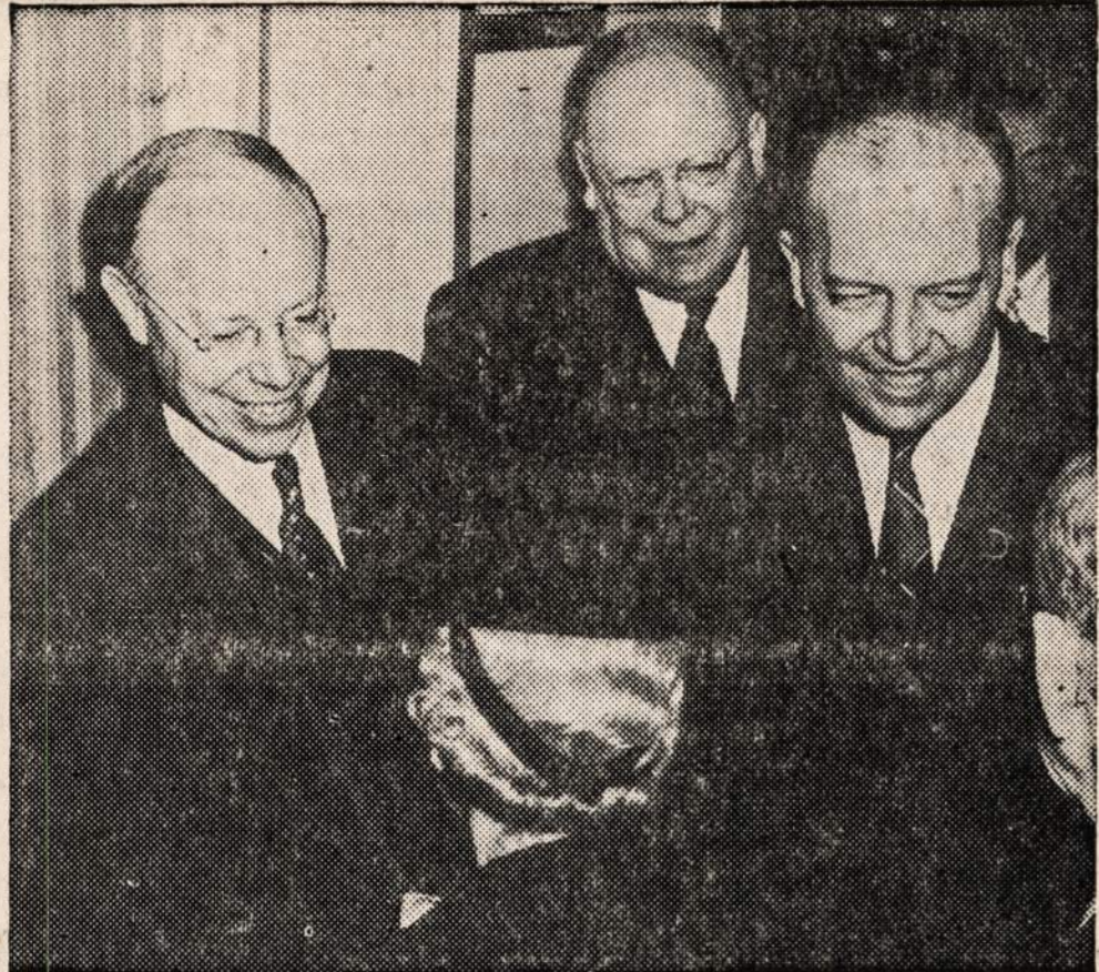
Senatorių Robert A. Taft (po kairės) ir Harold E. Stassen susitikimo su Iowa republikonais De Moines viename viešbutyje.