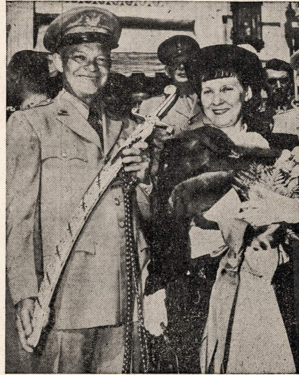
Gen. Dwight D. Eisenhower, J. V. armijos štabo viršininkas, apleidžia drauge su žmona Olandijos ambasadoriaus rezidenciją, kur jis buvo apdovanotas auksiniu kardū.