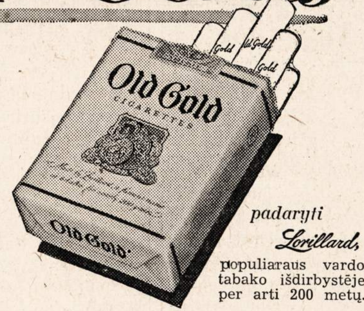
padaryti Lovillaud populiarus vardo tabako išdirbystėje per artį 200 metų.

Ar interesuotas esate tokia rūkyka? Tuomet užsidedkite Old Gold... gaukite pilną malonumą tabako aukščiausios rūšies, tobulai padarytas tikram MALONUMUI — ir niekam kitam!