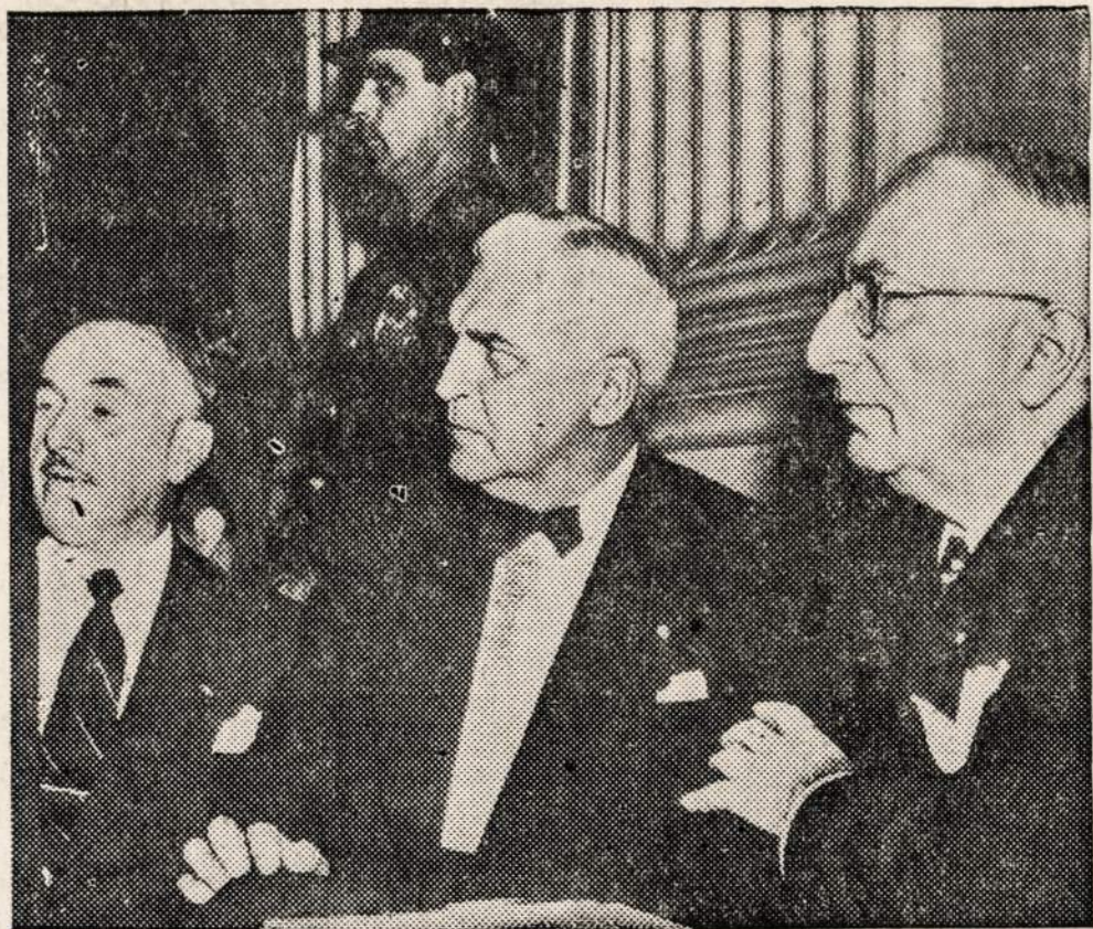
Washingtonė Ne-amerikoniško veikimo komitetas pradėjo komunistų veiklos Hollywood'e tyrinėjimą. Pirmas liudyti buvo pašauktas Jack L. Warner (po kairei), Warner Brothers vice-prezidentas. Liudijo taip pat Louis B. Mayer (po dešinei).

Vaikas lankė bažnytinę mokyklą ir skaitėsi pavyzdingu lauklėtiniumi.