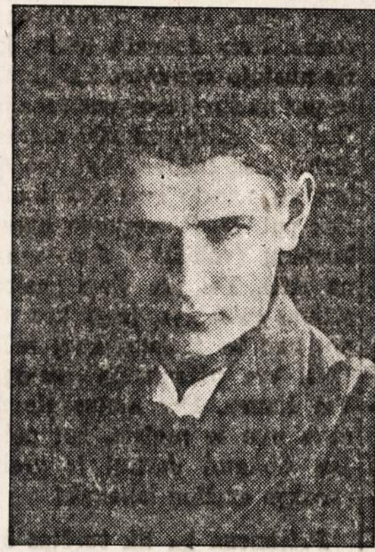
BALYS SRUGA kuris po savo "Naujienuose" spausdinamais raštais pasirašydavo Aktasmatė.

Iš Vilniaus atėjo žinia, kad tenai mirė po sunkios ligos žymus Lietuvos rašytojas Balys Sruga, sulaukęs tik 51 metų amžiaus. Jo sveikatą, matyt, pakirto badas ir vargas nacių koncentracijos stovykloje, kur jisai buvo išgabentas karo metu.